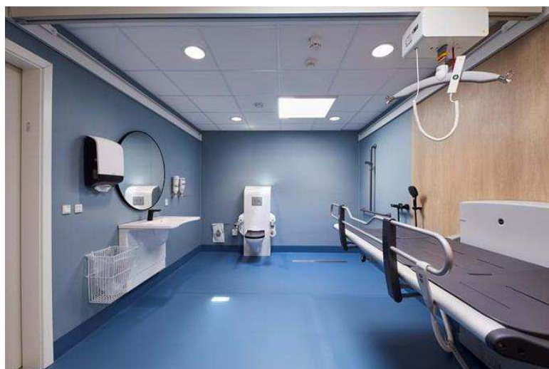
Illustration af såkaldt Spaces-handicaptoliet i Aarhus Kommune.

Parker, Kirkegårde og Renhold Kvalitet Njalsgade 17 Postboks 394 2300 København S