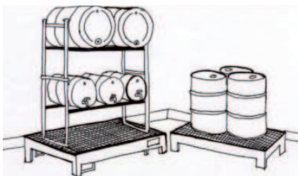
Figur 1. Indendørs opbevaring på spildbakke med rist.

Flere mindre beholdere kan med fordel placeres på en reol, som står på en spildbakke.