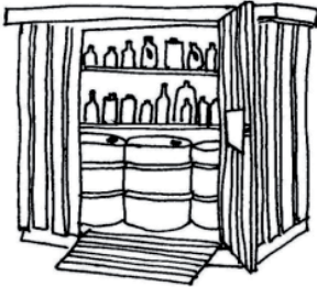
Figur 3. Container med spildopsamling og aflåselig port til opbevaring af mindre beholdere på fx byggeplads