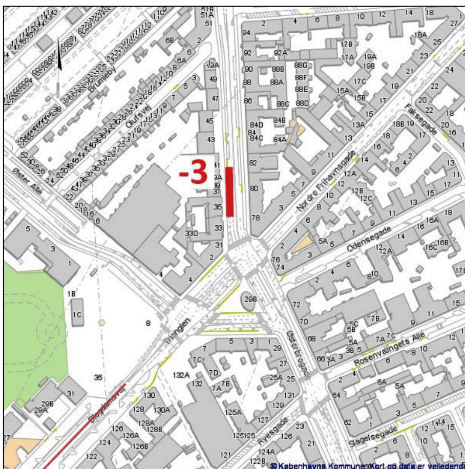
Kortet viser, hvor der nedlægges parkeringspladser på Østerbro

I forbindelse med projektet Tilpasning af busnet 2019 nedlægges i alt 14 parkeringspladser. Ti pladser nedlægges i blå betalingszone, heraf syv i beboerlicenszone Vesterbro (VB) og tre i Indre Østerbro (IØ). Derudover nedlægges fire pladser uden for betalingsområdet.