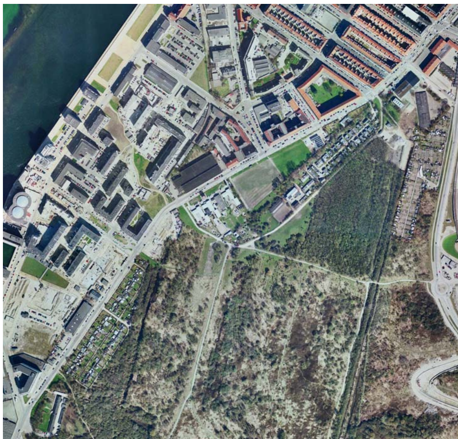
Den aktuelle del af Artillerivej mellem Njalsgade i nord og Drechselsgade i syd - "Artillerivej Nord".

Der udarbejdes forslag til det kommende vejanlæg i den videre projektudviklingsfase efter, at nærværende program er godkendt i Teknik- og Miljøudvalget.