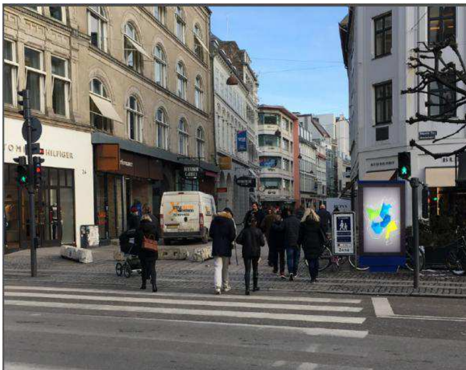
Billede: Ansøgt ændret placering af fritstående digital reklamestander på Østergade 21-23/Bremerholm.