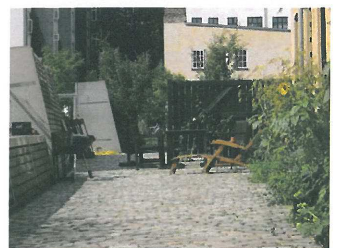
Foto af fremtidige forhold til inspiration