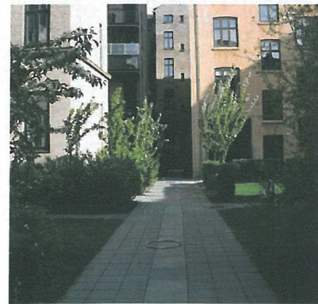
Foto af fremtidige forhold til inspiration