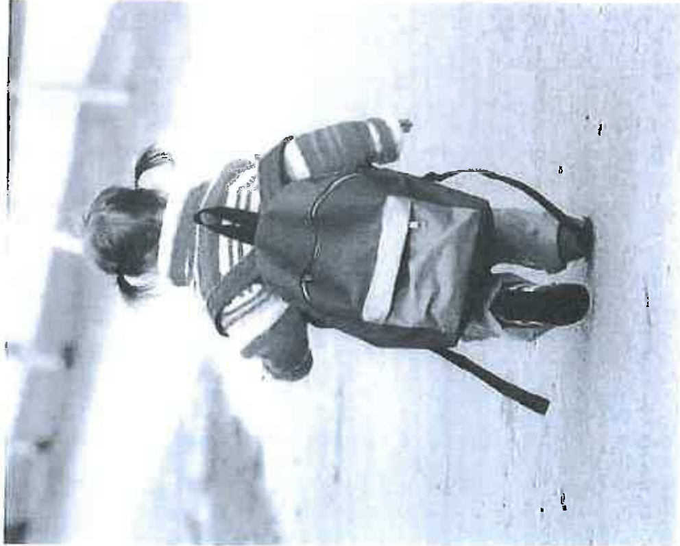
INSPIRATION TIL LIGEBEHANDLINGEN