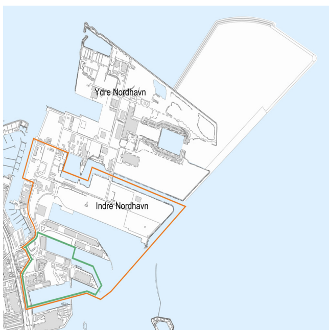
Lokalplanområde (grøn), Kommuneplanområde (orange)

Miljøvurderingen er udført parallelt med udarbejdelsen af forslag til lokalplan og kommuneplantillæg, hvor der har været mulighed for at påvirke udviklingen af planerne gennem vurdering af indsatser i planlægningen. Samtidigt har projektet være testet med kommunens bæredygtighedsværktøj, der supplerer miljøvurderingen.