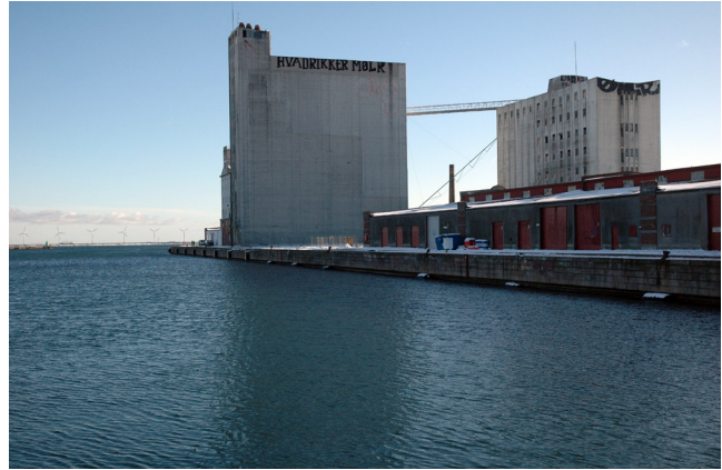
I dag er der et uhindret kik fra Stubbkaj ud over Kronløbsbassinet mod havneløbet.

Den kompakt bebyggede nye ø i Kronløbsbassinet ændrer oplevelsen af bassinets dimensioner og hindrer det frie udsyn til Øresund. Til gengæld tilbyder den nye udsigtsmuligheder fra en offentlig tilgængelig plads. Øen afgrænser et beskyttet vandrum mod Stubbkaj med gode rammer for idræt og rekreation ved vandet. Den er således et positivt element i bebyggelses- og byrumsplanen. Således vurderes anlægget af øen ikke at have væsentlige konsekvenser for havnens kulturarv og landskab.