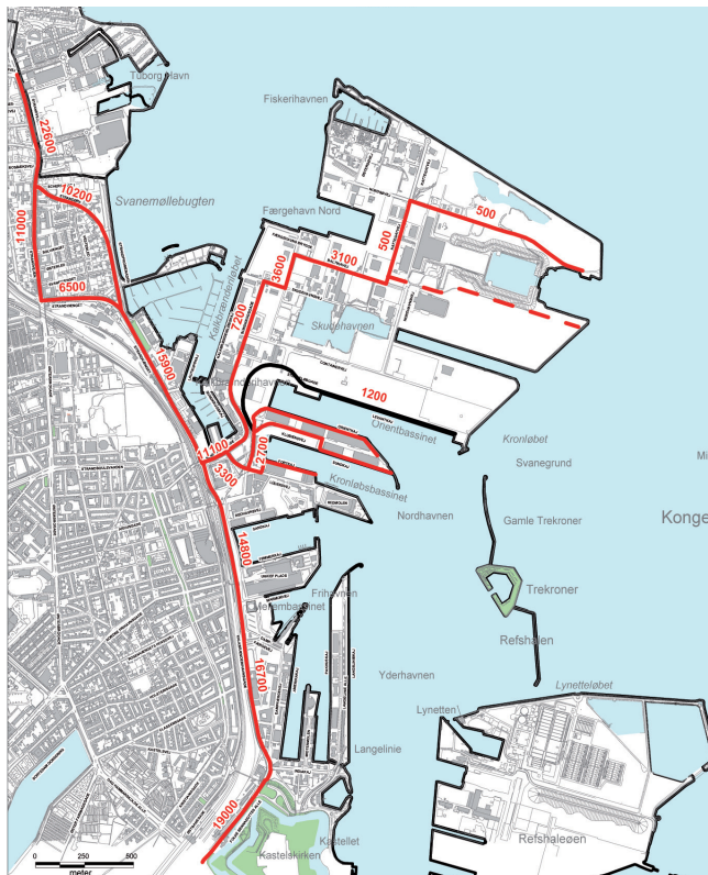
Beregnet antal køretøjer på hverdage kl. 6-18 i begge retninger i år 2009. Kort fra VVM-rapport vedr udvidelse af Nordhavn og ny krydstogstterminal.