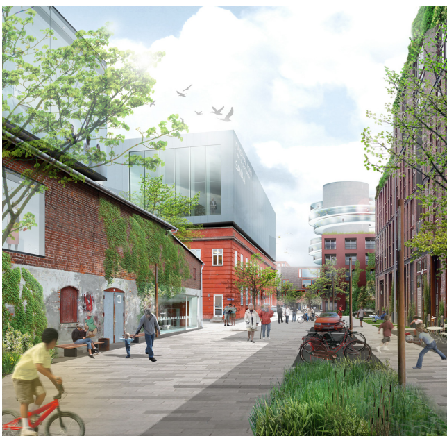
Illustration af et stræde indrettet som sivegade med flexzoner til parkering og regnvandsbede.

Planens blå og grønne elementer har en positiv påvirkning på den biologiske mangfoldighed og natur i Århusgadekvarteret. De træer, som tillades fældet, tilhører ikke sjældne arter og er ikke i sig selv umistelige. Den nye beplantning med hjemmehørende arter og artsvariation i