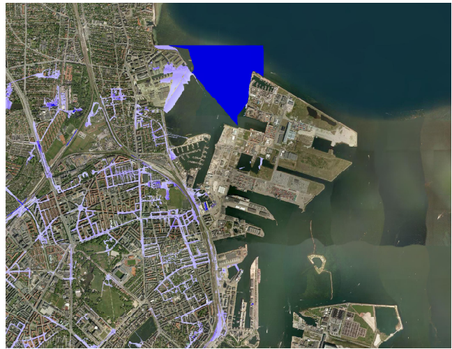
Figur 1: Regnvand. Beregnede potentielle oversvømmelsesområder ved en hundrede-års hændelse om hundrede år, uden klimasikring og under forudsætning af at de anvendte prognoser for udvikling i klimaet holder stik. Kortudsnit fra COWI 2008.

I forbindelse med klimatilpasningsplanen for København er der gennemført beregninger af forskellige regnskyls betydning for byen. På figur 1 er vist et udsnit af et resultat af en beregning af et regnvejr der statistisk set