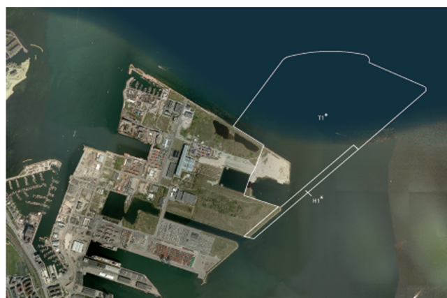
Udvidelse af Nordhavn og ny Krydstogstterminal

Udvidelsen kan ikke realiseres før det ovenfor omtalte lovforslag om flytning af containerterminalen i Københavns Havn er vedtaget. Afgrænsningen af opfyldet vil blive justeret i overensstemmelse med lovforslaget.