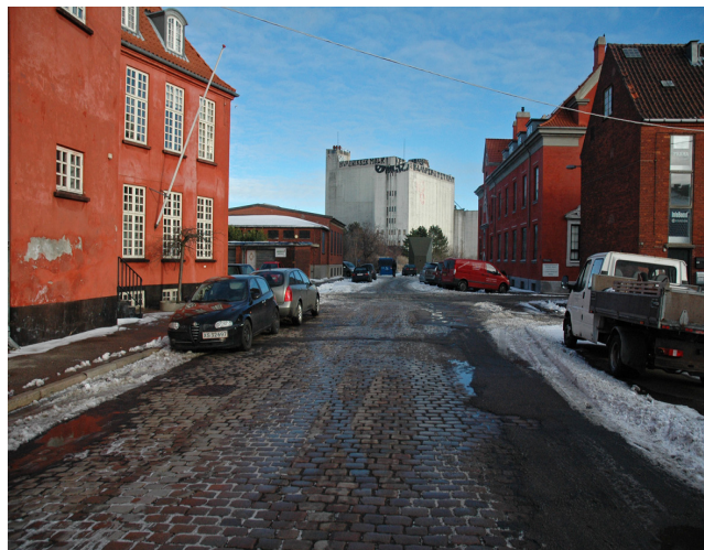
Århusgade med det bevaringsværdige bebyggelsesmiljø

Området omkring Fiskerihavnen i den nordvestlige del af Ydre Nordhavn, uden for planområdet, anvendes til maritime aktiviteter, erhvervsfiskere, sejlkubber og værft. Området repræsenterer et særligt miljø med betydelige kulturhistoriske værdier.