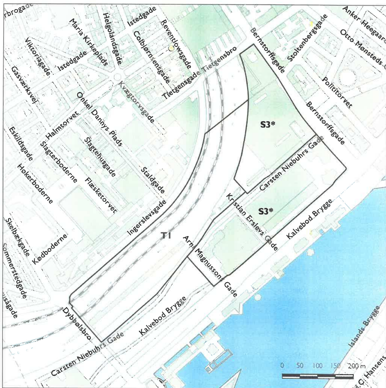
Forslag til ændrede kommuneplanrammer. Kort A.

I medfør af Lov om Planlægning (lovbekendtgørelse nr. 1529 af 23. november 2015) ændres følgende rammer: