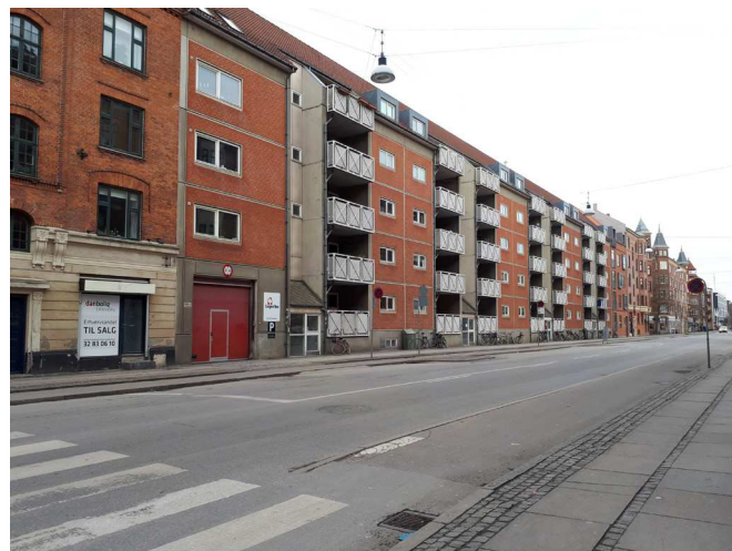
Holmbladsgade set fra Vermlandsgade

Området ligger i den kystnære del af byzonen. På grund af den betydelige afstand samt de mellemliggende bebyggelser og anlæg opfattes området imidlertid ikke som en del af kysten. En visualisering i forhold hertil er derfor ikke påkrævet.