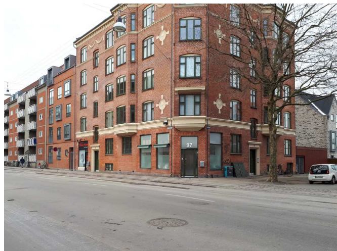
Holmbladsgade set fra Carlsgade

Fællesskab København vil spille sammen med og styrke en række andre af kommunens politikker, planer og strategier.