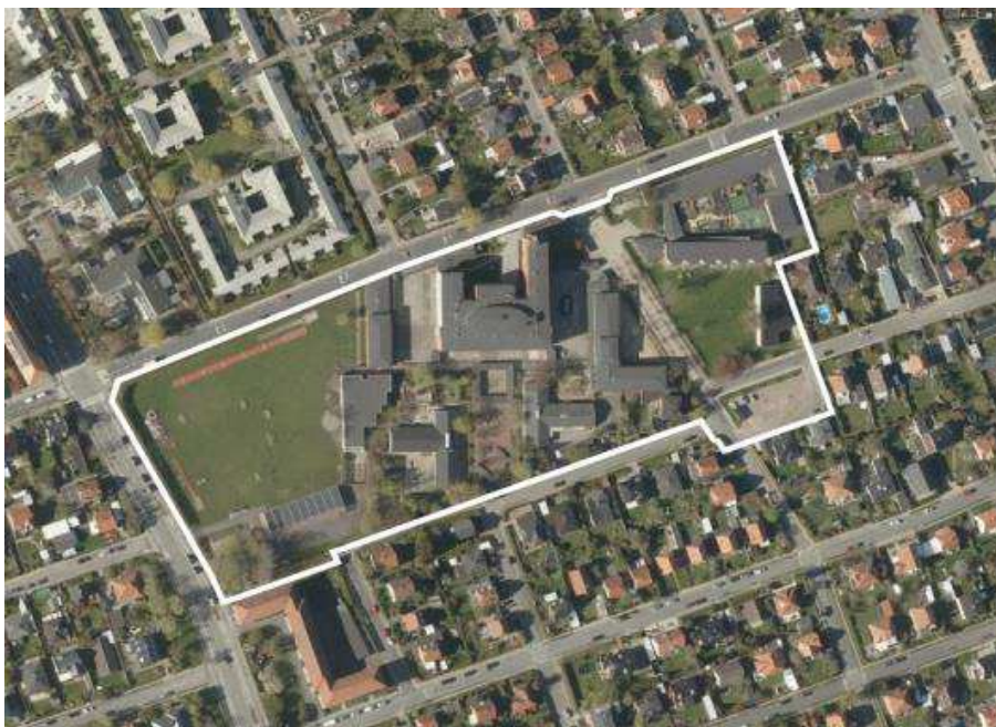
Luftfoto, Skolen ved Sundet, 2017