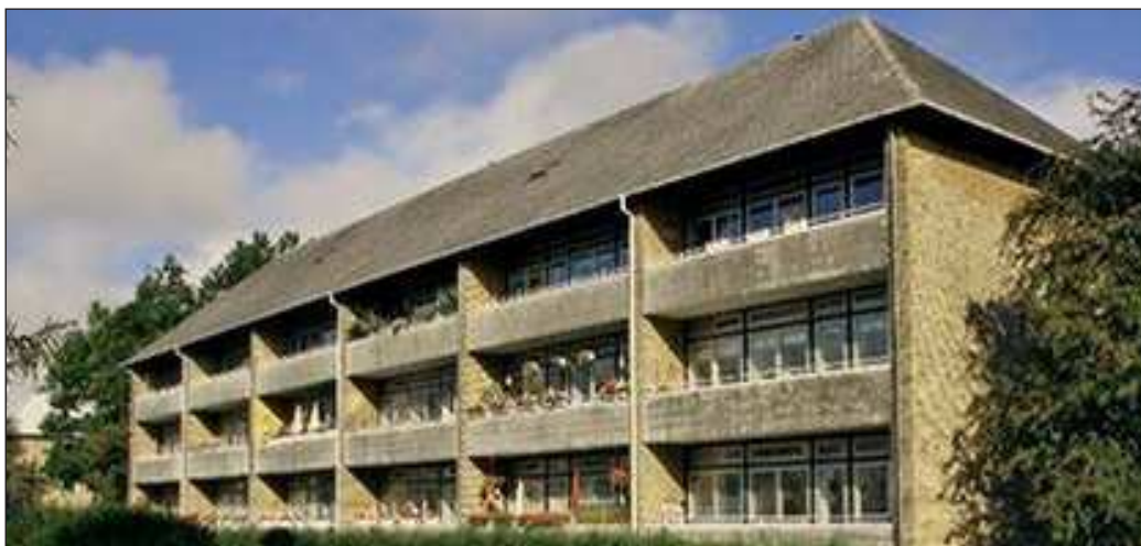
AAB AFD. 38

Det er derfor formålet med projektet i at formidle viden om Kay Fiskers byggeri for AAB 38.