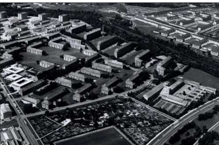
AAB AFD 38, 1960

Endeligt vil vi gøre en stor indsats for at styrke interessen for udstillingen ved at kommunikere igennem de lokale foreninger og ved at invitere til offentlige foredrag om Kay Fisker og AAB 38.