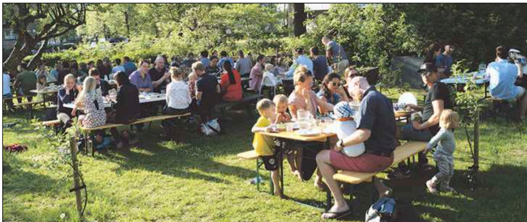
BEBOERARRANGEMENT PÅ PLÆNEN

Sociale Indsatser, nemlig en forening af beboere, der ønsker at styrke et boligområdes stolthed via en usædvanlig indsats et usædvanligt sted med mange udsatte.