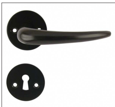
KAY FISKERS H NDTAG OG LAMPE