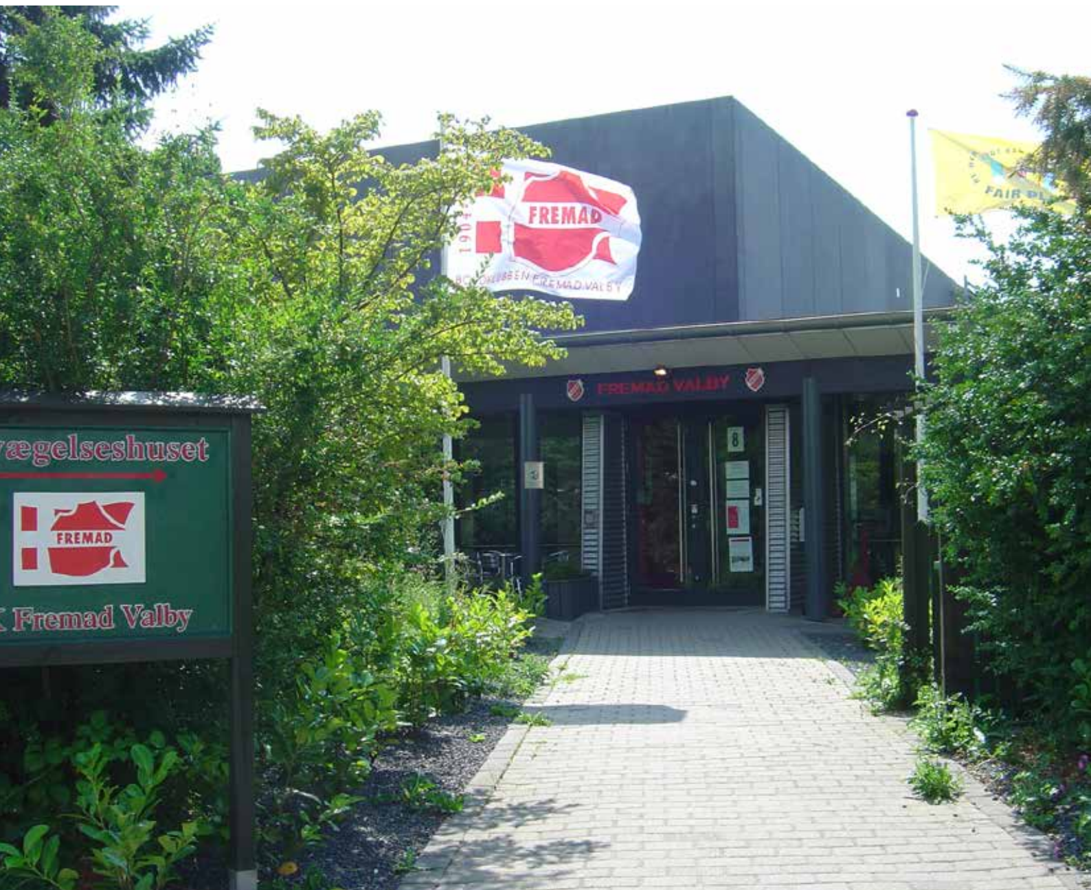
Bevægelseshuset Fremad Valby