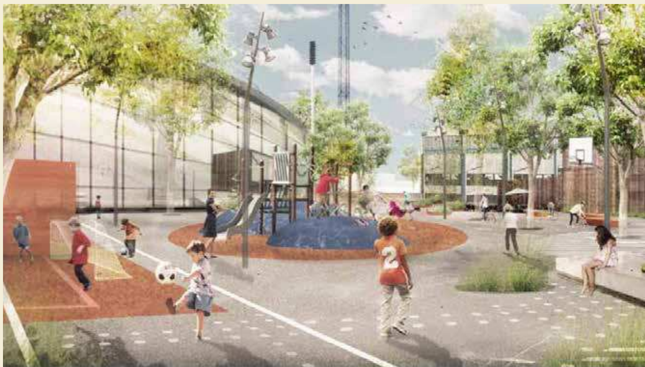
Visualisering af mulig udformning af byrummet syd for Club Danmark Hallen (Tegnestuen Vandkunsten)

”Endvidere fastlægges to tunneler under Køge Bugt-banen til fodgænger- og cykeltrafik. Derved bliver det muligt at komme til idrætsparken fra Folehave-området og andre dele af Valby på en nemmere måde end i dag. Den ene tunnel placeres ved Blushøjvej og den anden gennem den nedlagte Ellebjerg Station, hvor det er aftalt med DSB Ejendomme, at den eksisterende passage kan genetableres.