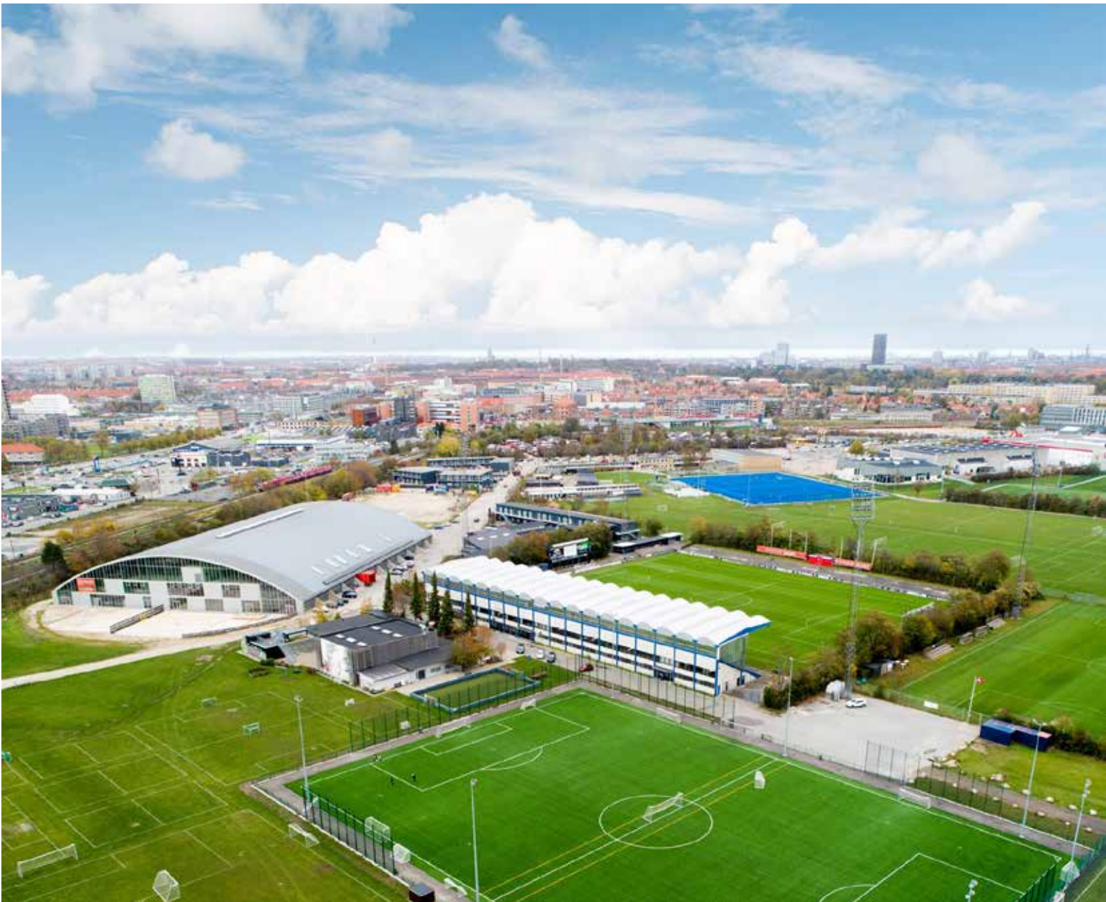
Bevægelsehuset Fremad Valby