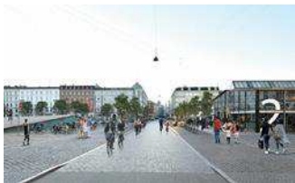
Den Grønne Cykelgade og de levende byrum i det bæredygtige kvarter