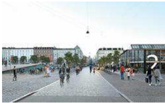
Den Grønne Cykelgade og de levende byrum i det bæredygtige kvarter