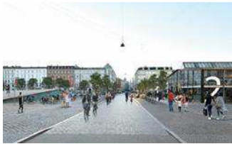
Den Grønne Cykelgade og de levende byrum i det bæredygtige kvarter

Vi drøfter meget gerne fælles etablering og koordineret drift af et systematisk grønt og livgivende islæt der sikrer helhed i strækningen. Vi er i gang med at etablere kontakter til og aftaler med både Lokalrådet og Botanisk have i bestræbelserne på at skabe helhed mellem de nyetablerede grønne gårde i karreerne og forgrønning til gadesiden.