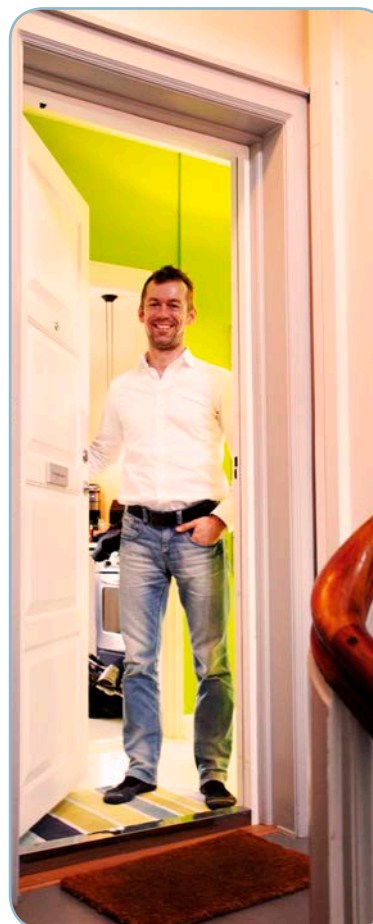
HH VærtNiels R.S.

I maj 2013 åbnede Human Hotel desuden i New York som del af IDEAS CITY ( www.ideas-city.org ) – en festival om fremtidens by og byudvikling. Human Hotel fortsætter i New York i samarbejde med en række lokale kulturinstitutioner.