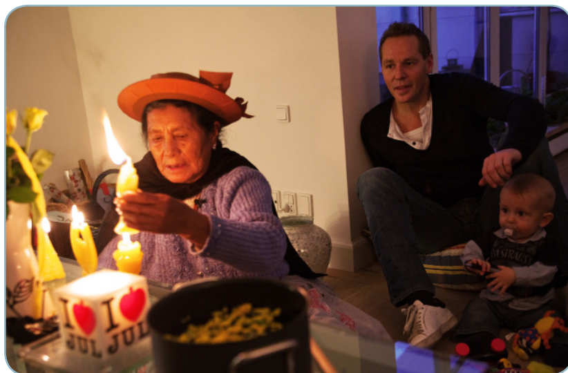
Peruviansk shaman udfører et ritual hos sin værtsfamilie under COP15 (2009).