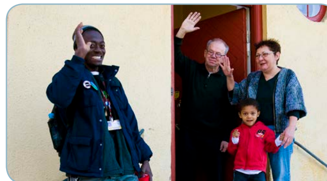
Ugandas fotojournalist forlader fra sin værtsfamilie.