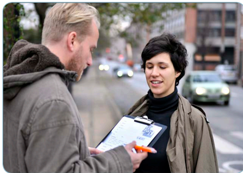
Human Hotel holdet på arbejde. En ny vært skrives op!

På baggrund af et succesfuldt Human Hotel under ESOF, samt med en ny database i ryggen, er det vores mål fremadrettet at samarbejde med Københavns mange kulturbegivenheder om at intelligent matche kunstnere, musikere og andre besøgende med værtsfamilier i verdens mest gæstfri by!