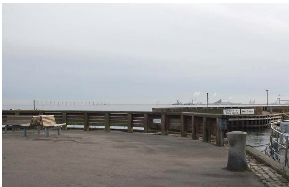
Figur 8 Visualisering af det fremtidige udsyn fra Skovshoved Havn mod Københavns Havn. Ud over nye vindmøller på Lynetten er der indtegnet den vedtagne udvidelse af Nordhavn og ny krydstogtterminal, muligheden for højhuse på Marmormolen samt planerne for et nyt Amagerforbrændingsanlæg.

Møllerne vil blive opstillet i et område, der i forvejen er præget vindmøller og tekniske anlæg. Ud over de nye vindmøller er der planer om andre nye tekniske anlæg og bygninger i havneområdet. Disse omfatter en udvidelse af Nordhavn og ny krydstogtterminal, højhusbyggeri på Marmormolen samt et forslag om en