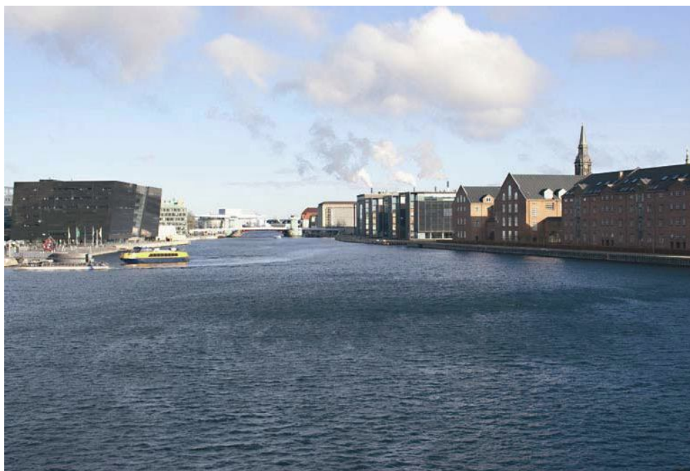
Figur 5 Eksisterende udsyn fra Langebro mod nordvest. Afstanden til nærmeste eksisterende vindmølle er ca. 4 km.