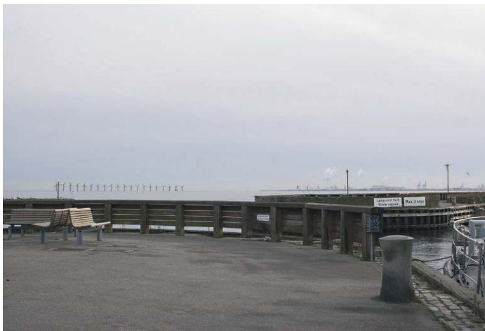
Figur 7 Eksisterende udsyn fra Skovshoved Havn mod Københavns Havn. Der er ca. 7,2 km til de eksisterende vindmøller på Lynetten.