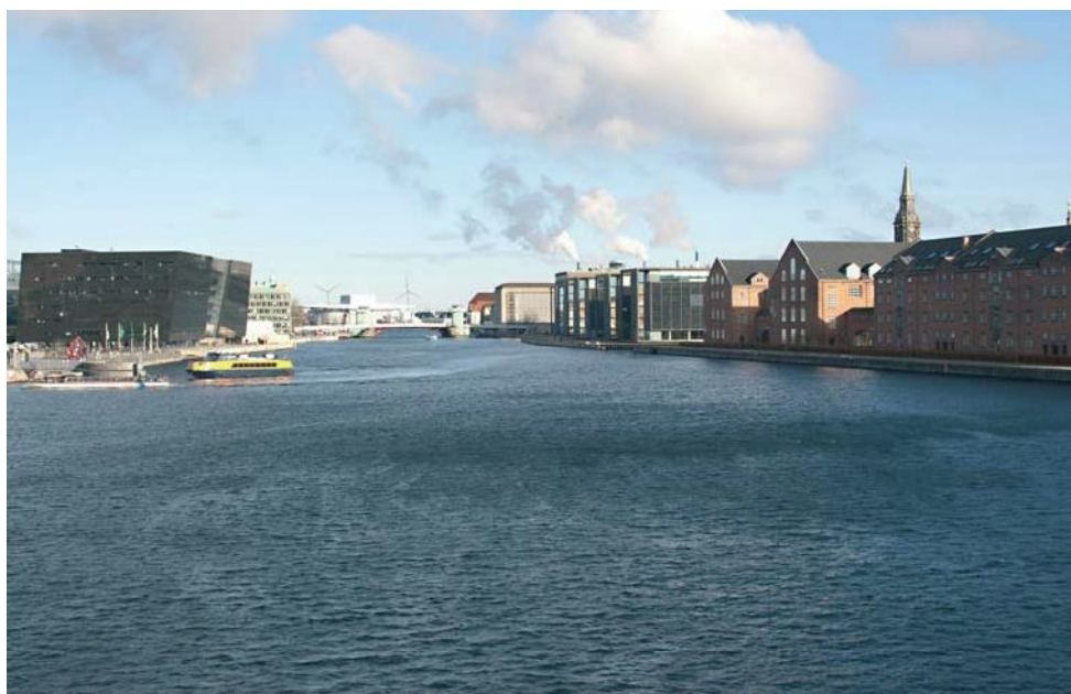
Figur 6 Visualisering af det fremtidige udsyn fra Langebro mod nordvest. Afstanden til nærmeste vindmølle på Lynetten er ca. 4 km. To af de nye vindmøller er skjult bag Den Sorte Diamant.