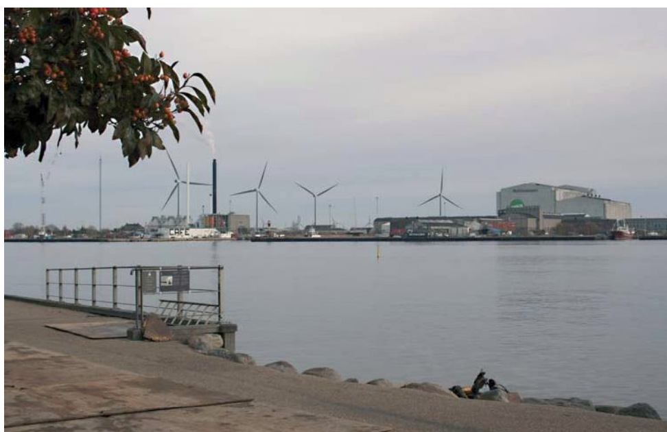
Figur 4 Visualisering af det fremtidige udsyn over Refshaleøen fra Langelinie. Afstanden til den nærmeste nye vindmølle er ca. 1,4 km.