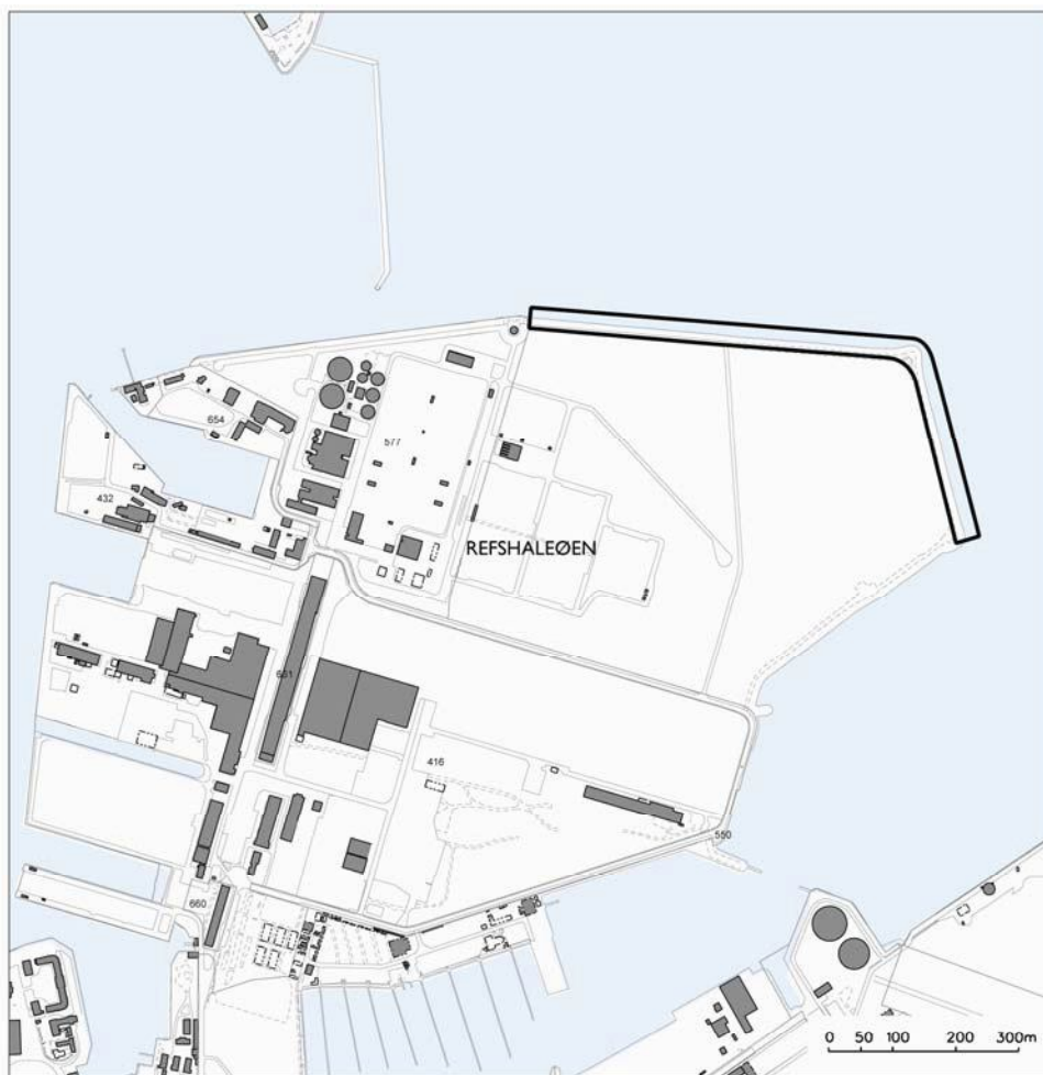
Figur 2 Område til opførelse af vindmøller på Lynetten i forslag til kommuneplantillæg for store vindmøller i København.

Forslaget til kommuneplantillæg for store vindmøller i København udlægger et område på Lynetten til opførelse af vindmøller. Området fremgår af Figur 2.