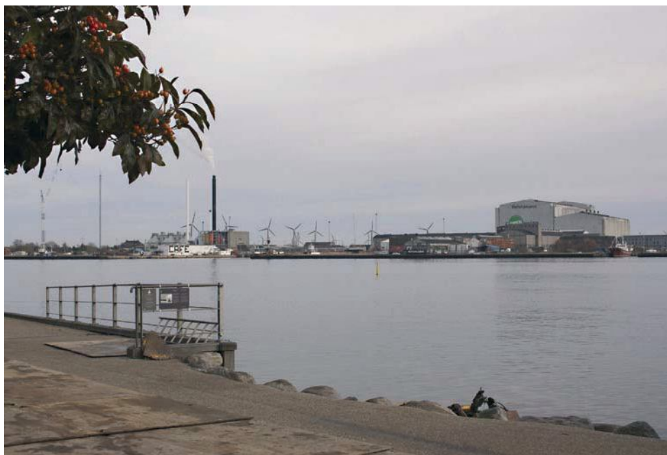
Figur 3 Eksisterende udsyn over Refshaleøen fra Langelinie ved Den Lille Havfrue (mens hun var på Expo 2010 i Kina). I horisonten ses de eksisterende syv vindmøller på Lynetten. Den nærmeste eksisterende vindmølle ligger ca. 1,4 km fra udsigtspunktet.