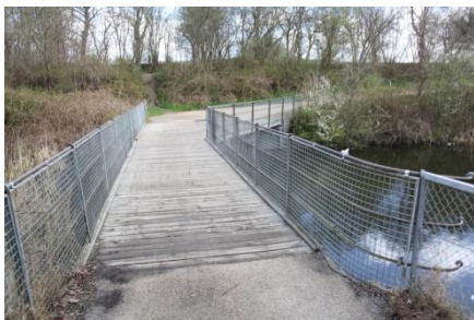
Eksisterende forbindelse over Vestvolden til Tingbjerg

Uden flere og forbedrede forbindelser er det vanskeligt at forestille sig, at indsatser rettet mod erhvervsliv eller socialt udsatte for alvor kan vende udviklingen.