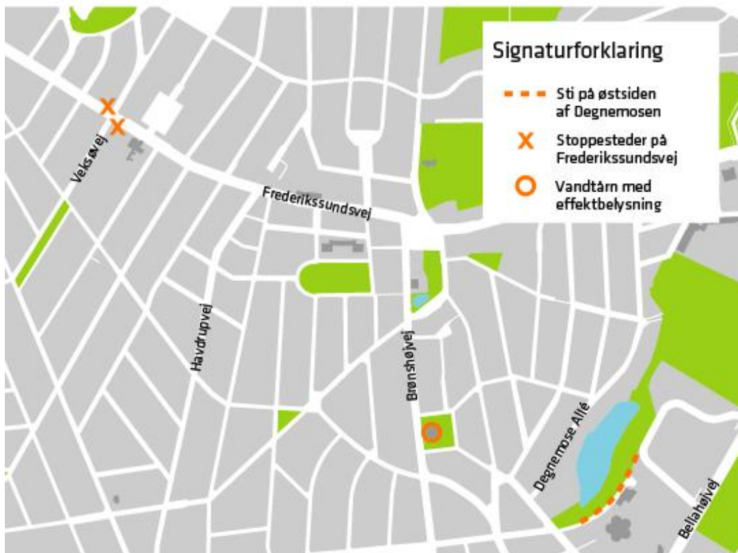
Figur 1. Oversigtskort med delprojekters placering