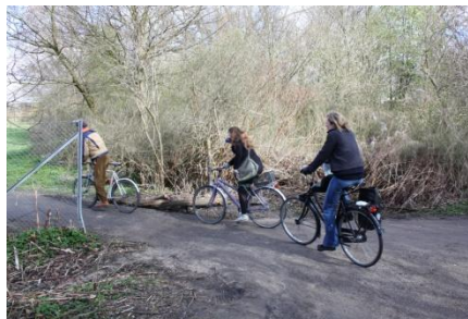
Eksisterende forbindelse fra Utterslev Huse til Gladsaxe