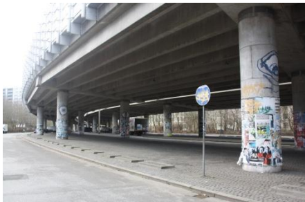
Arealet under Bispeengbuens

Bispebjerg/Nordvest, med en lang ”ryg”, der vender sig bort fra de omkringliggende byområder.