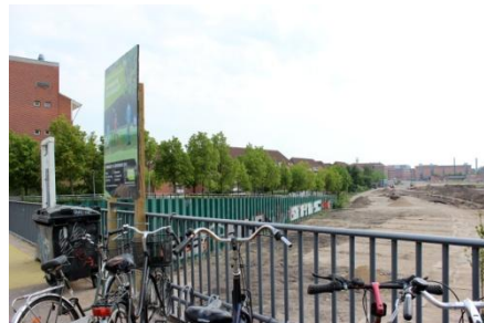
Den kommende aktivitetspark på DSB-arealet