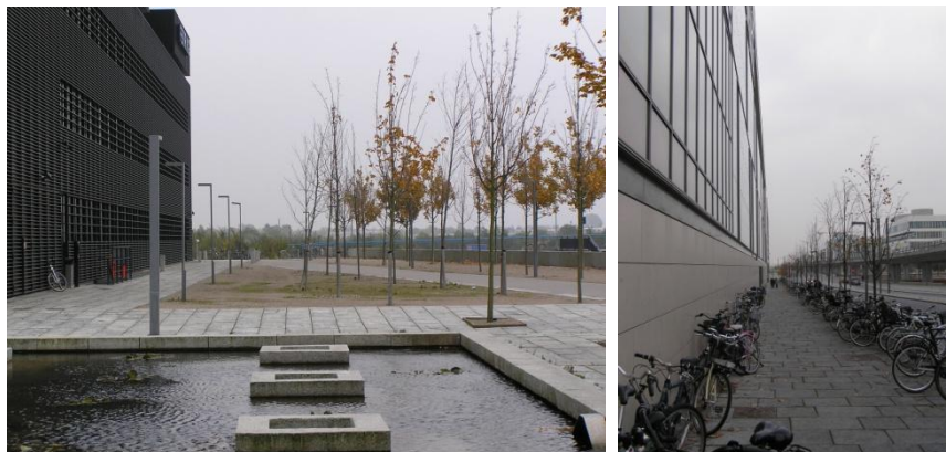
Udsnit af Kay Fiskers Plads og gadeforløbet langs Field's i Ørestad City