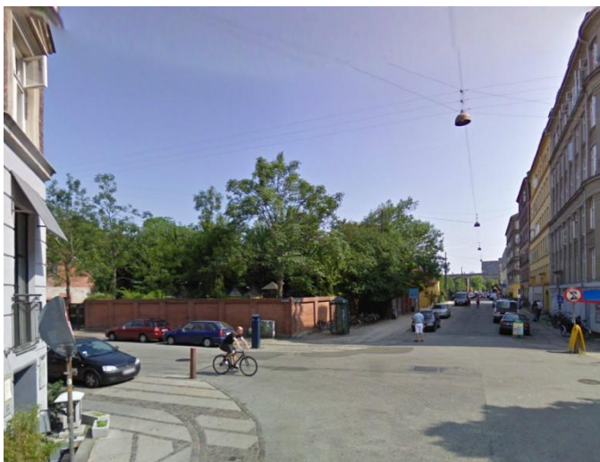
Hjørnet Møllegade og Guldbergsgade, hvor den nye plads skal etableres ved den røde murstensmur