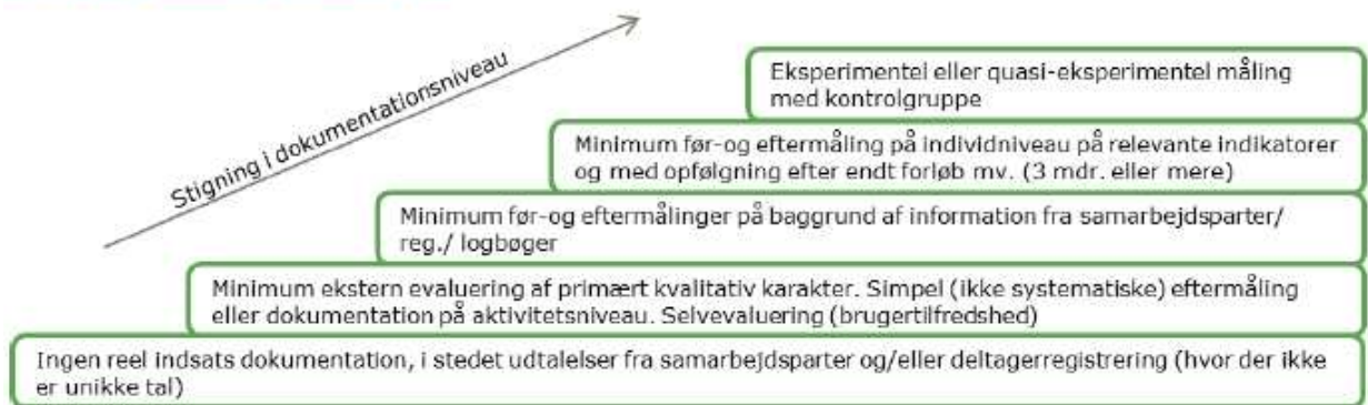
Figur 6-1 Dokumentationstrappe

Hvis aktiviteterne dokumentationsniveau ligger på et af de lavere trin, vil de score lavere ud fra dette kriterium. En aktivitet kan øge dokumentationsniveauet ved at gå et trin op af stigen.