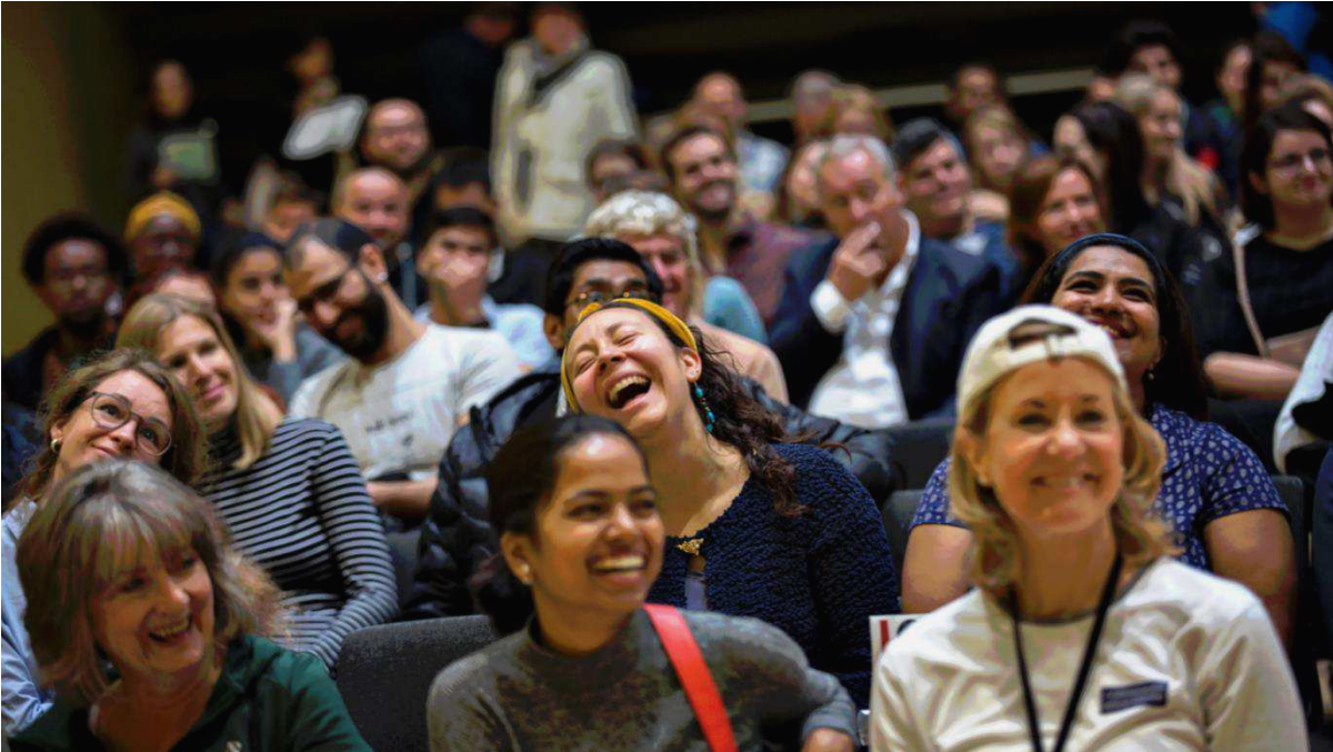
fra International Citizen Days i 2021