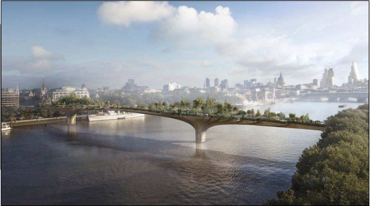
Garden Bridge, London.

Projektet er bl.a. inspireret af planerne om "Garden Bridge" i London, hvor der skal skabes en ny grøn forbindelse over Themsen. Også genåbningen af Cheonggyecheon floden i Seoul og "The Big Dig" i Boston kan tjene som inspiration til hvordan verdens førende storbyer sammentænker trafiksanering og grøn bynaturudvikling.