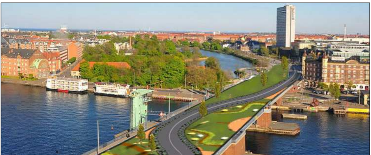
Designing the Green Bridge of Copenhagen - 2015

af Nicolle Shandrow, Laura Antul & Samee Swartz - Worcester Polytechnic Institute, Massachusetts