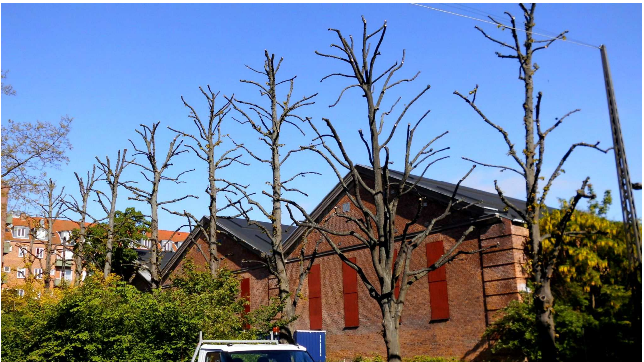
Pladsen foran det gamle Øresundshospital