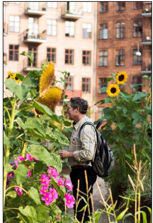
Byhaven ved Majporten

Et af de forslag, som Miljøpunkt Amager har arbejdet med, er at sammentænke Ladegårdså-projektet på Nørrebro med Amager. Herigennem kan der skabes et sammenhængende grønt byrum hele vejen fra Bispeengbuen over H.C. Andersens Boulevard, forbi Rådhuspladsen og ud til Amager Boulevard og Amager Fælled. Undervejs i dette forløb vil der blandt andet kunne skabes en "Grøn Langebro", der medvirker til at skabe en grøn korridor mellem det indre København og Amager.