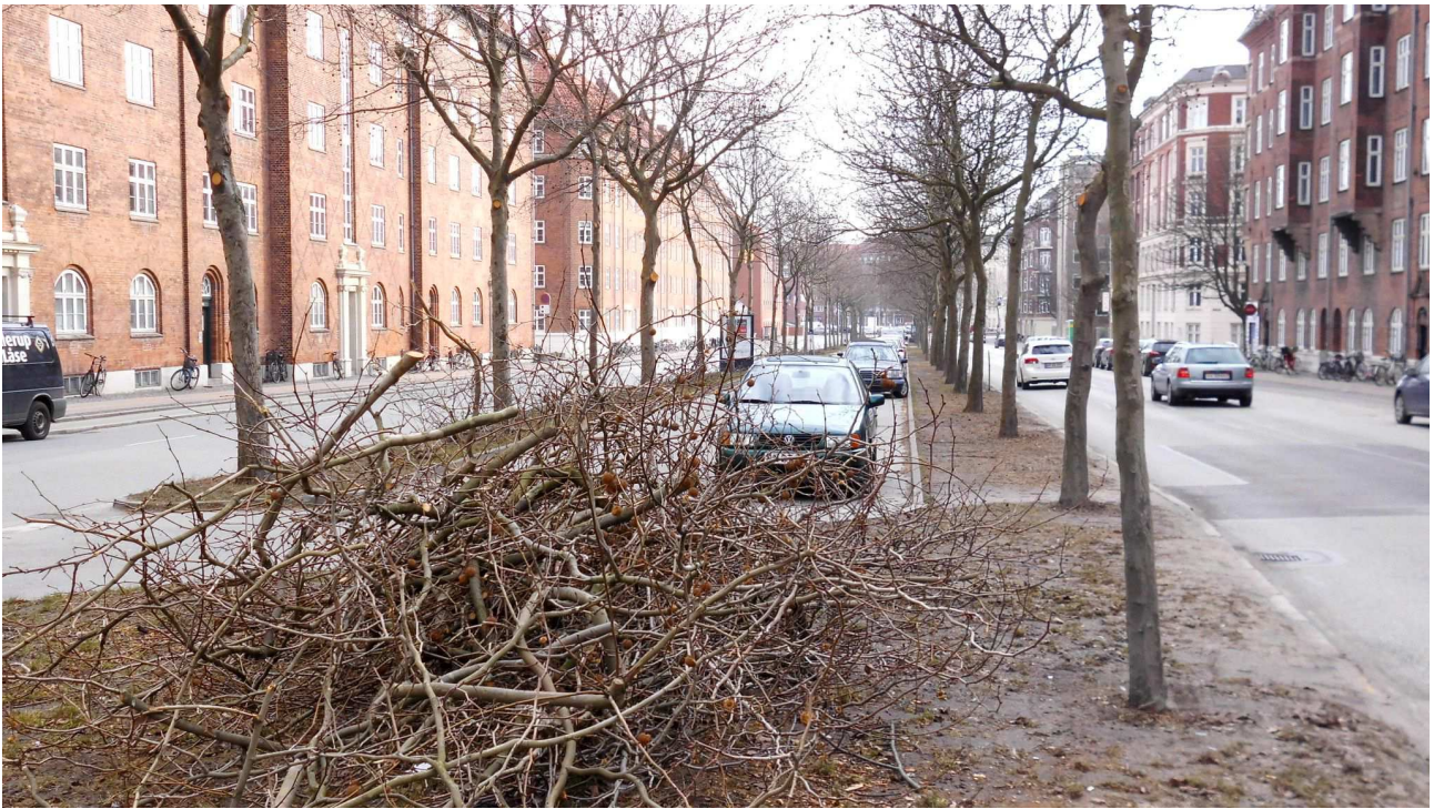
Beskæring på Strandboulevarden set fra hjørnet v/Randersgade