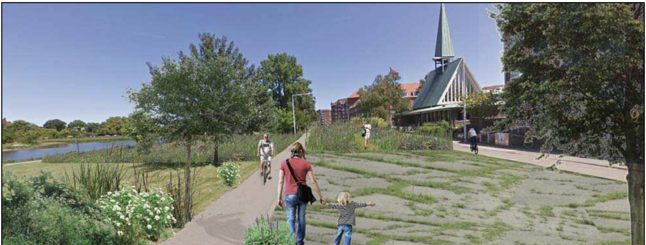
Greenway Transformation of Amager Boulevard - 2014

Også langs Amager Boulevard og Stadsgraven vil der kunne arbejdes med udvikling af bynaturen på en ny og utraditionel måde.