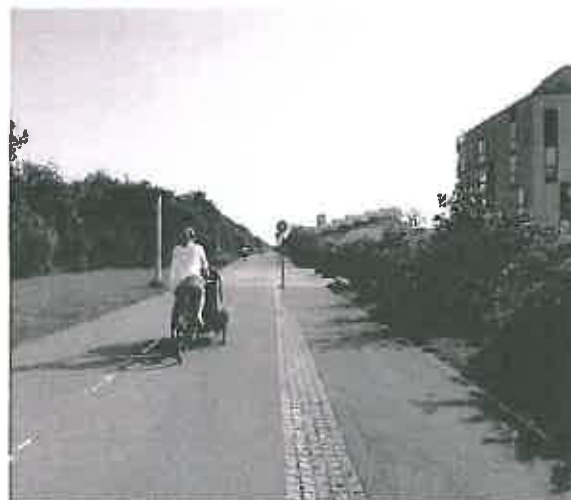
Cykelstien til Ørestad skole morgen og eftermiddag BILAG 2