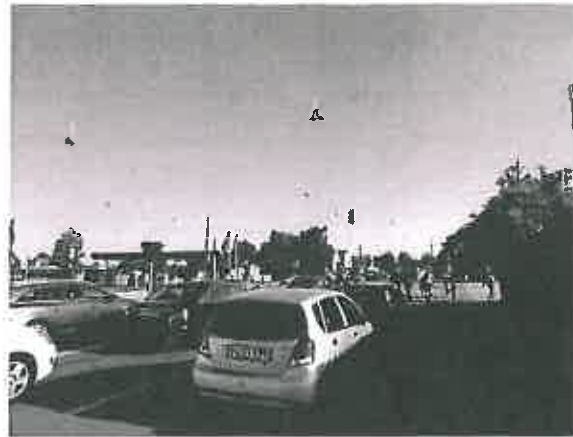
Vejlands Allé, morgentrafik