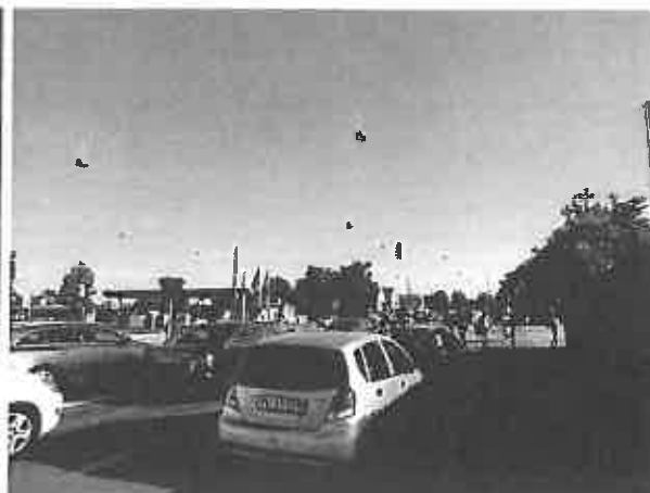
Vejlands Allé, morgentrafik