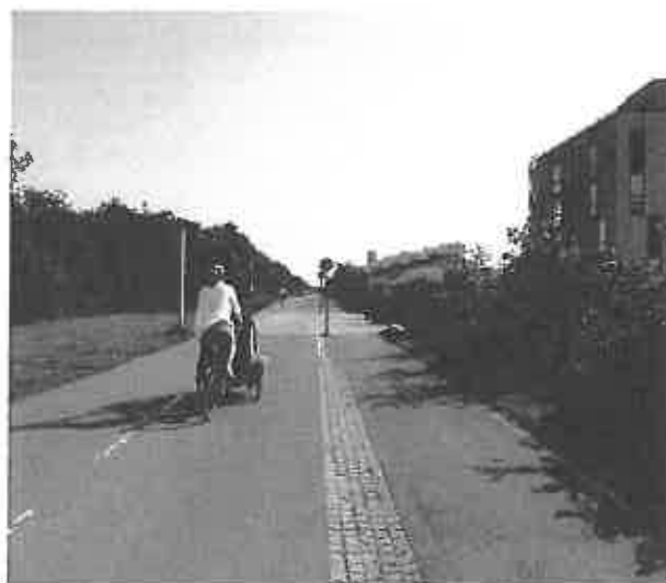
Cykelstien til Ørestad skole morgen og eftermiddag