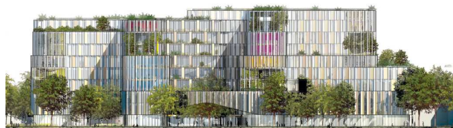
Facade mod sydøst. Illustration: 3XN.

På baggrund af en konkret vurdering i forhold til antallet af ansatte og besøgende etableres der 500 cykelparkeringsplader i området, heraf er halvdelen overdækkede.