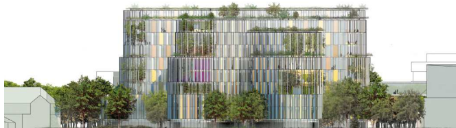
Facade mod sydvest. Illustration: 3XN.

Amorparken mod vest ligger sammen med Fredens Park, som en grøn kile mellem Rigshospitalet og Tagensvej. Parken er anlagt i 1910 samtidigt med Fælledparken. Parken blev fra begyndelsen anlagt som en symmetrisk