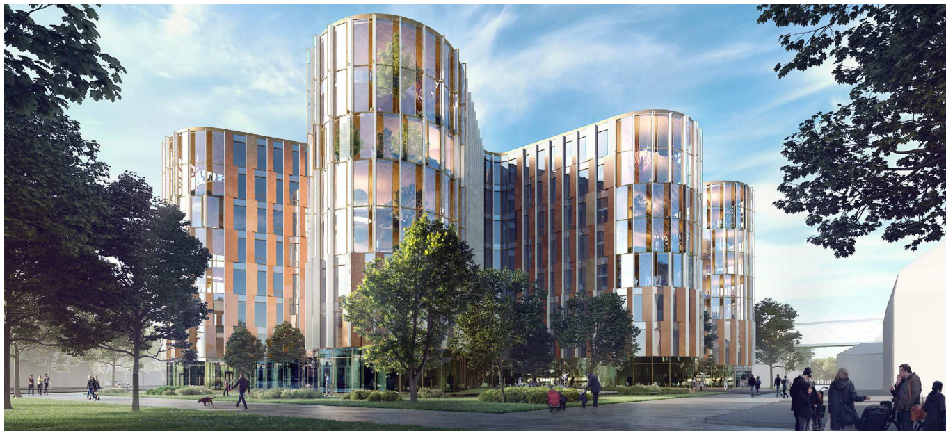
Bebyggelsen set fra sydvest. Illustration: 3XN.