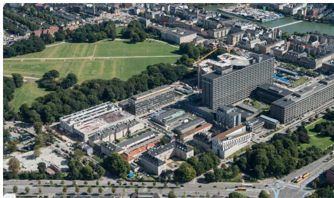
Rigshospitalet set fra nordvest.