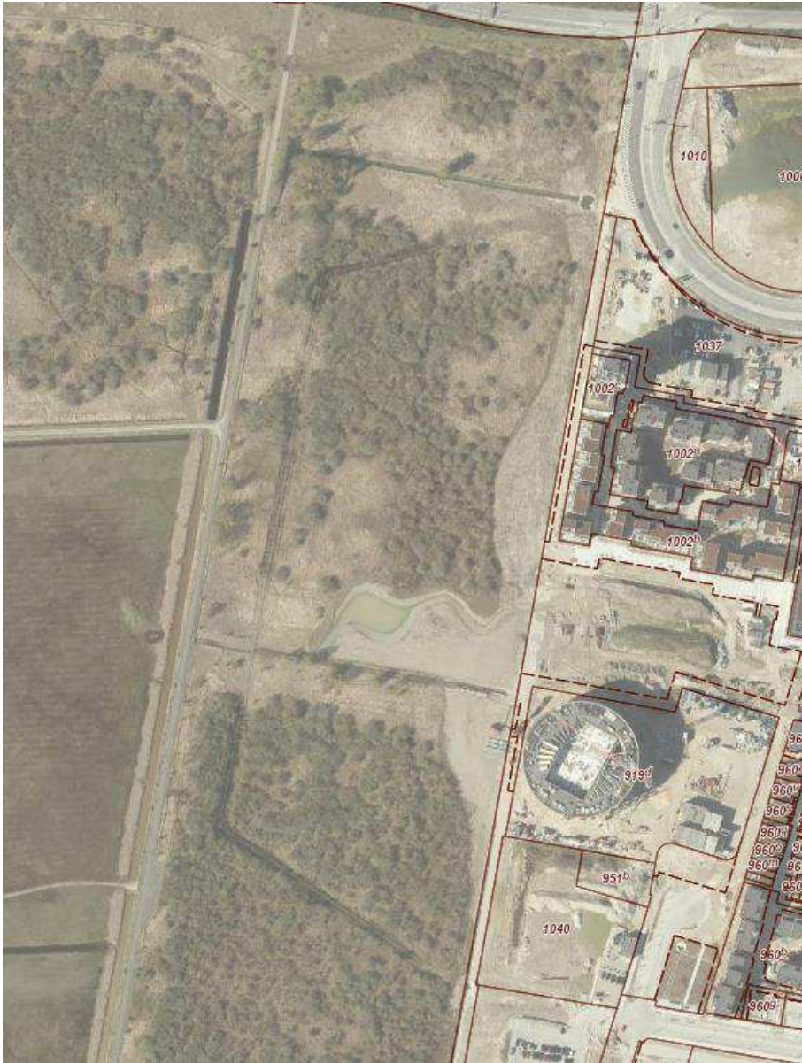
Luftfoto fra foråret 2017. Området med bar jord vest for den røde matrikelgrænse viser det samlede indgrebs udstrækning.