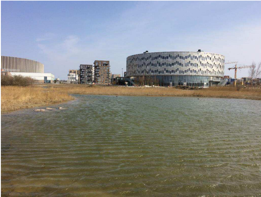
Den nye sø