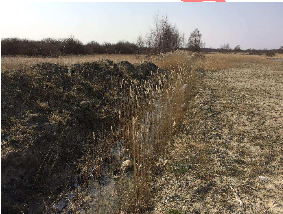
Jordpåfyldningen set fra øst mod vest