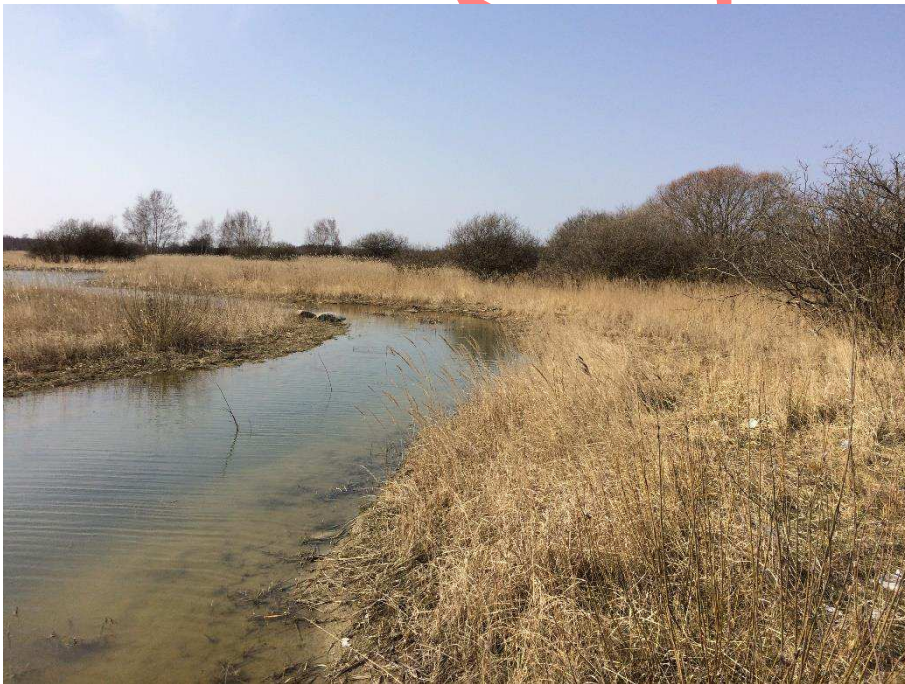
Det nye vandløb