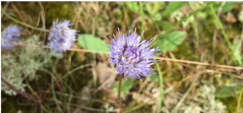
Figur 4 Blåmunke vokser på næringsfattige og lysåbne steder.

Ved etableringen blev terrænreguleringen anlagt mellem 10 og 20 m for langt ud i strandengen i forhold til det ansøgte og fremviste projekt. Udstrækningen af terrænreguleringen vil blive reduceret, så den svarer til det ansøgte projekt. Skråningen er anlagt med hældning på 5% og er vestvendt. Skråningen er etableret med næringsfattig råjord og er efterladt til fri succession. Ud fra de nærmeste frøkilder samt skråningens struktur og næringsfattige bund forventes det, at floraen, der indfinder sig på skråningen, med tiden får karakter af strandoverdrev med arter som rundbælg, blåmunke, rød svingel, hare-kløver og andre kløverarter, Figur 4. Disse arter trives fint i næringsfattig råjord. Strandoverdrev findes typisk i forlængelse af strandenge på de højt beliggende og tørre partier og i naturbeskyttelseslovens forstand ses strandoverdrevet derfor også som en funktionel, landskabelig del af strandengen. Det vurderes, at naturværdien på skråningen kan bidrage til at skabe variation og flere habitater. Naturtilstanden på de tilstødende arealer vurderes at være dårlig, da det er tilgroet med nogle få dominerede arter. Området er tidligere strandeng, men er i dag domineret af især gråpil, tagrør og bjerg-rørhvene.