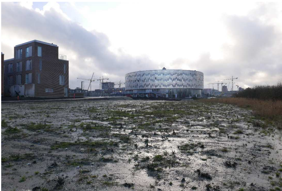
Figur 2 Terrænreguleringen set mod Kalvebod Fælled Skole.

Figur 3) før de nye oplysninger indtraf, ansøges hermed om en lovliggørende dispensation.