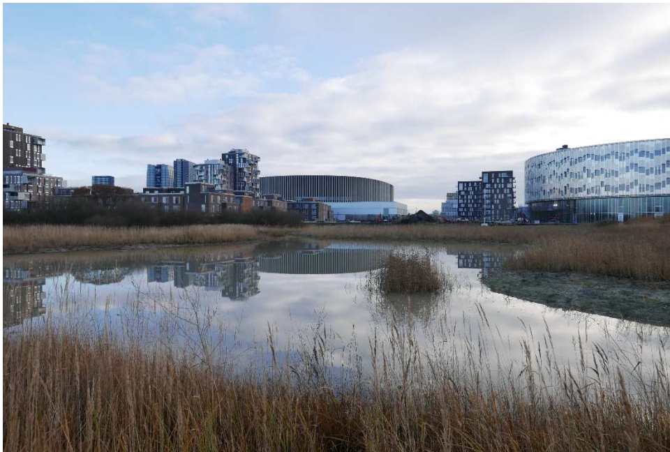
Figur 3 Det nyetablerede paddedam set fra øst.