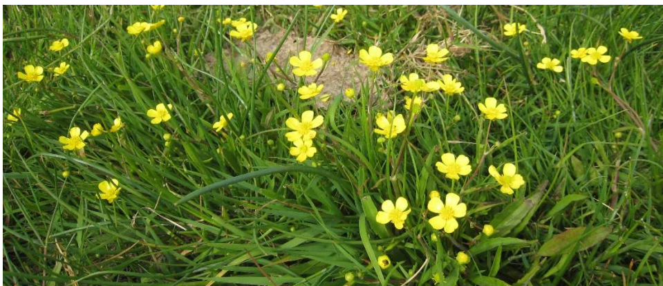
Figur 5 Kærranunkel vokser typisk i moser, enge eller i bredzonen.

Senest har Naturstyrelsen og Sund & Bælt fået midler til et fælles projekt for at forbedre hydrologi af Natura 2000-områder på Vestamager. Projektet munder ud i, at regn- og drænvand fra motorvejen, via en pumpestation, kan pumpes ind på Kalvebod Fælled, hvor det ledes gennem grøblerender (lave grøfter) ud til områder, hvor der ikke kan sikres tilstrækkelig høj vandstand i engfuglenes yngleperiode.