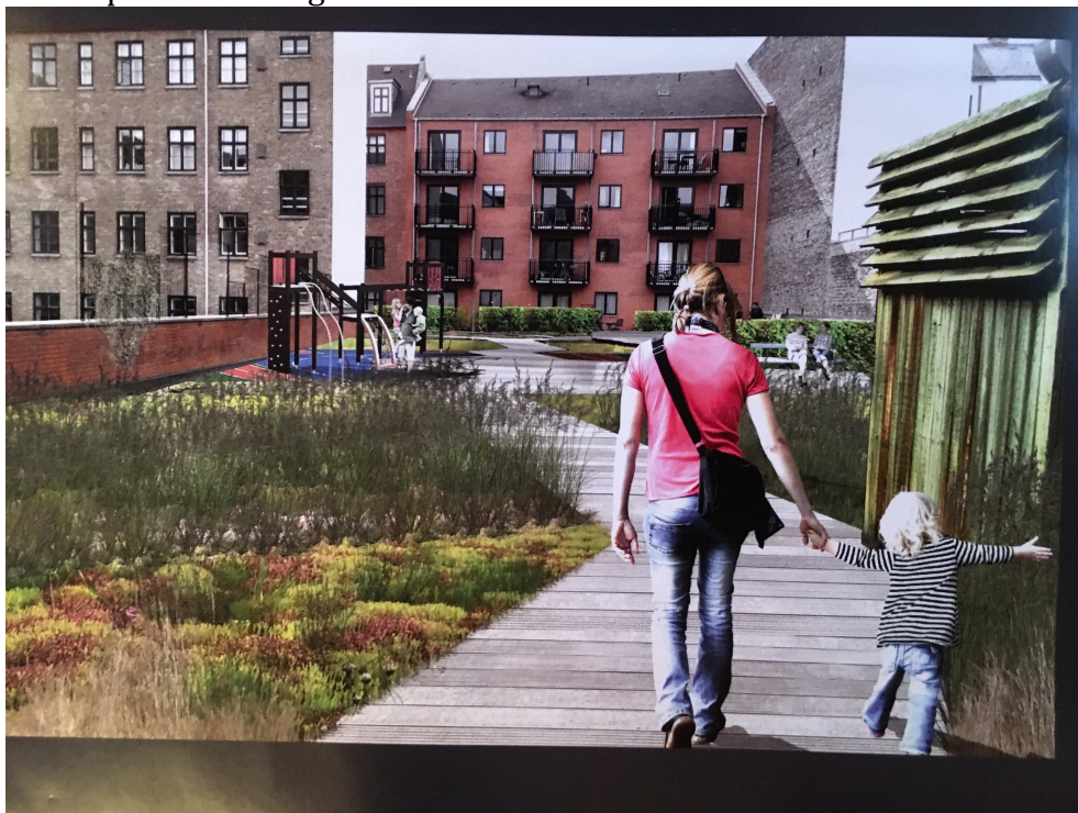
Eksempel 1 Digitaliseret "Alternative facts" foto

Vi forbeholder os ret til, med opsættende virkning, at sende Gårdhaveprojekt, fælles gårdhave Nordre Frihavsgade, Petersborgvej til ombudsmanden.