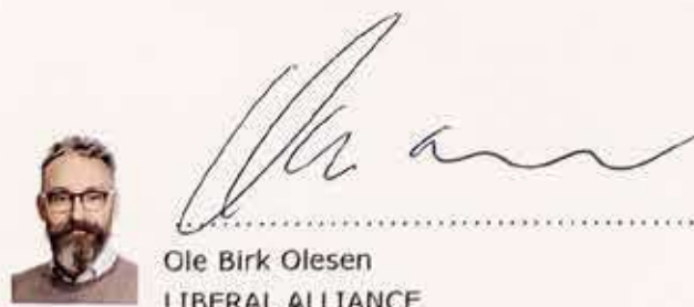
Ole Birk Olesen LIBERAL ALLIANCE