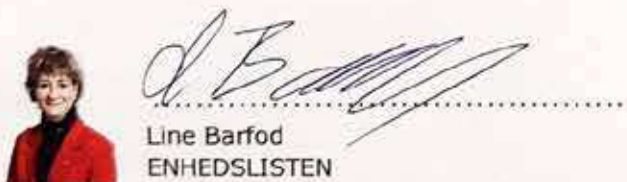
Line Barfod ENHEDSLISTEN