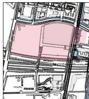
Forslag til kommuneplantillæg: Ny afgrænsning

Baggrunden er, at der med de planmæssige ændringer af Arenakvarteret, umiddelbart syd for bymidten Ørestad City Center, er skabt behov for udlæg af detailhandelsareal i dette område, hvorfor der her er fastlagt et lokalcenter med op til 3.000 m 2 detailhandelsareal. Forudsætningerne for at bymidten Ørestad City skal omfatte arealer både nord og syd for Øresundsforbindelsen er herved ændret