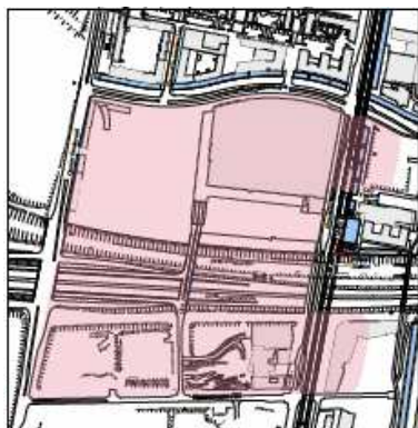
Kommuneplan 2011: Bymidte Ørestad City

Med det aktuelle kommuneplantillæg justeres afgrænsningen af bymidten "Ørestad City Center", således at området syd for Øresundsforbindelsen udtages af bymidten. Den samlede mulighed for udvidelse af detailhandelsarealet i bymidten på 15.000 m 2 ændres ikke.