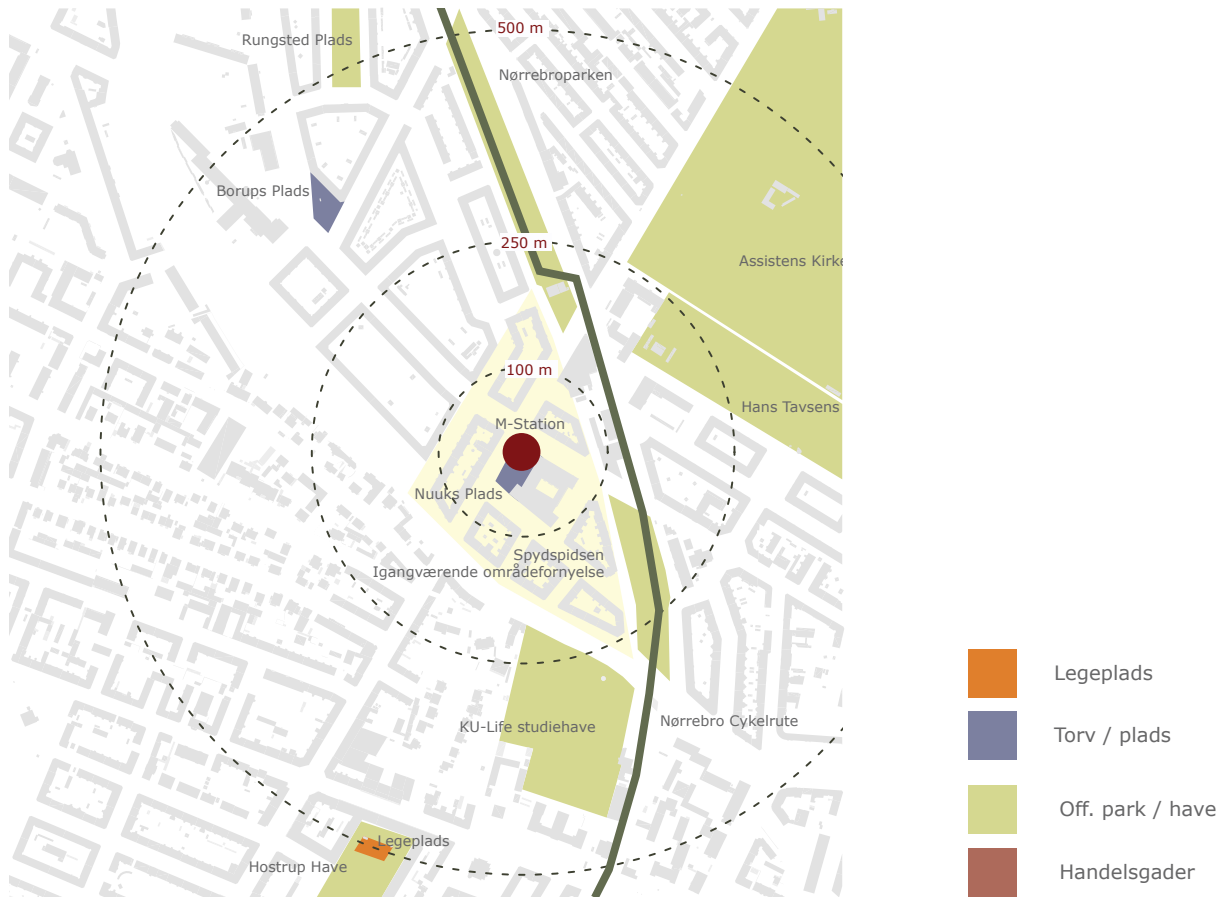
Stationsnærhedsområde ved Nuuk's Plads metrostationsplads (illustration, Metroselskabet)