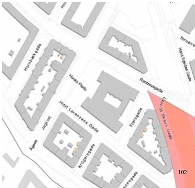
Lokalplaner i området

udnyttelse af gaderummene indgår et ønske om at skabe rum til bevægelse, oplevelser og fællesskab på en sjov og tryk vis i grønne og urbane omgivelser. Lokalplanen understøtter en forbedring af byrummet ved Landsarkivet, som får en mere grøn og urban karakter med plads til ophold og byliv. Lokalplanen rummer mulighed for yderligere funktioner såfremt der opstår mulighed for dette.