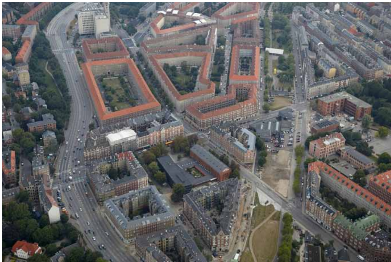
Nuuk's Plads, 2010