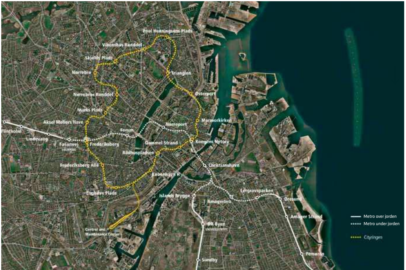
Oversigt over Cityringens linjeføring