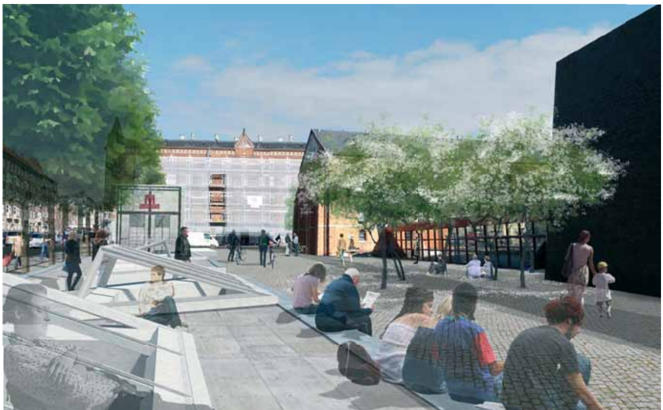
Visualisering af fremtidig metrostationsplads - Nuuk's Plads (illustration, Metroselskabet)