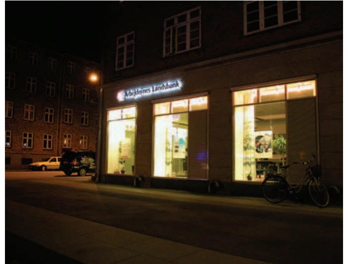
Skiltebelysning med coroneffekt (bogstaver, der er belyst bagfra) løser på fin måde eventuelle blændingsproblemer.