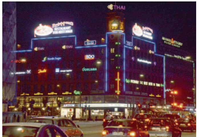
Det er vigtigt, at de forskellige reklamer og skilte indordner sig i en helhed uden at overdøve hinanden.