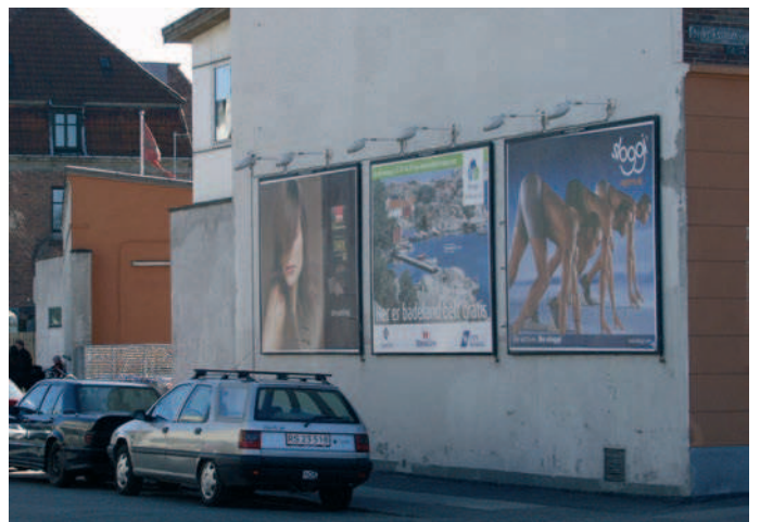
Billboards kan opsættes på brandgavle i industriområder og på byggepladshegn.