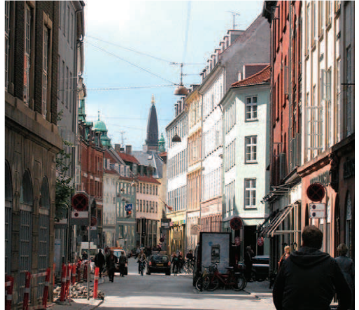
Snævre gaderum med diskrete facader giver ringe mulighed for reklamering.

Gågaderne i Indre By er livlige handeleggader, og reklamer er en del af gadebilledet.