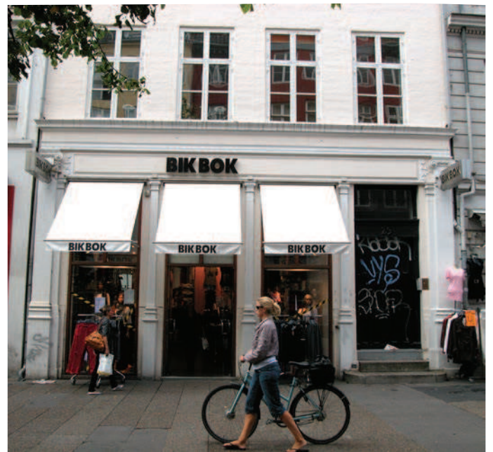
Markiserne her respekterer bygningens fagdeling. Skiltning sker på markisekanten.