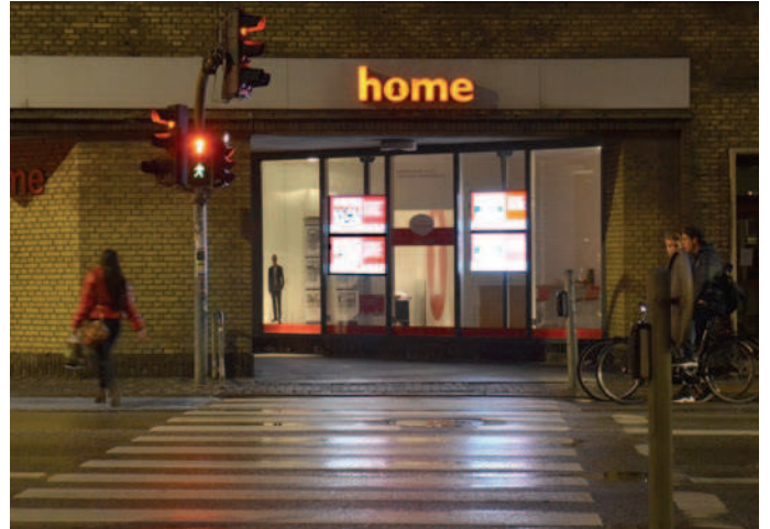
Eksempel på skærme i et butiksvindue.

Projicering af lysbilleder må kun ske ved helt særlige begivenheder af generel interesse for byen og kun på bygninger, der ikke benyttes om natten - og kun med ejerens tilladelse.