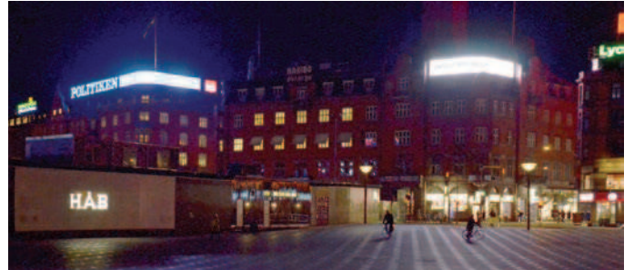
Lysviserne ved Rådhuspladsen er et bidrag til stedets puls. Det er afgørende, at især de digitale lysreklamer reguleres efter lysforholdene om dagen og om aftenen.