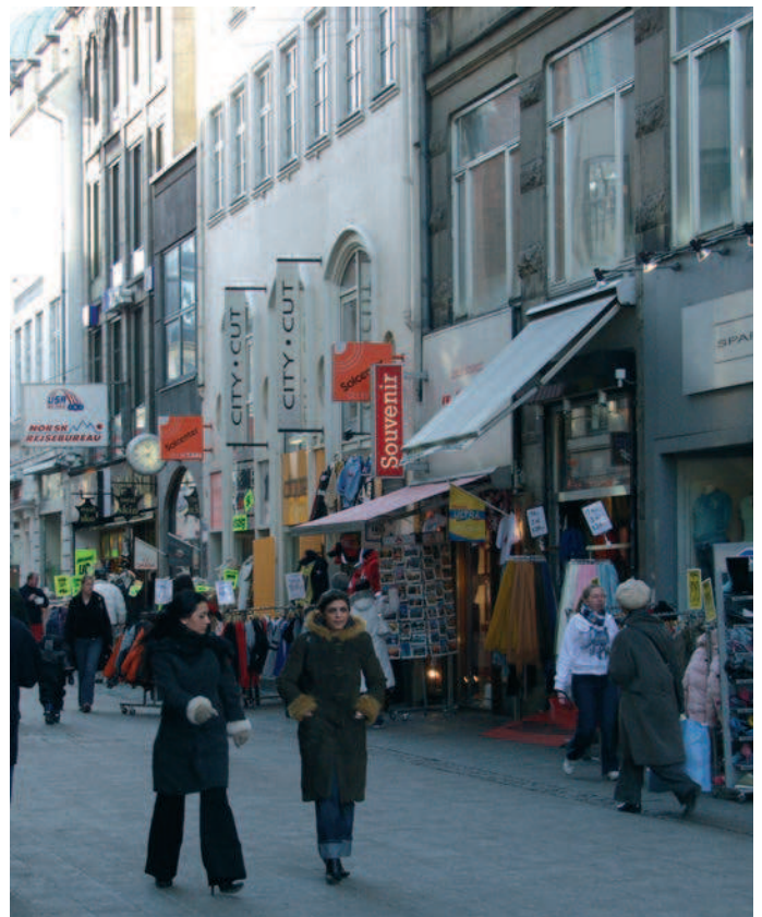
Skiltningen i den Indre By skal tilpasses byens mindre skala og må ikke sløre bygningens facader.