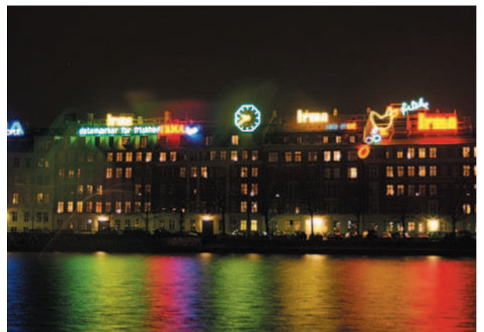
Reklamer er med til at sende et signal om en dynamisk og levende by og kan give et festligt indslag - ikke mindst lysreklamerne i byens nattebillede.

give anledning til gener i forhold til annoncører, brugere og omboende. Det vil fremgå af godkendelsen, hvilke specifikke krav lysreklamen skal opfylde med hensyn til udformning og funktion.