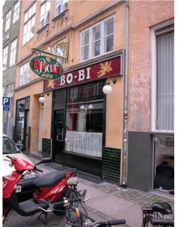
Skiltningen formidler på en enkel måde, hvad der forhandles, samt butikkens navn på en måde som er fint tilpasset kvarterets arkitektur.

Det er afgørende for en god skiltning, at forbrugeren ikke forvirres af for mange informationer. Skiltningen skal derfor være enkel, klar og tydeligt formidle, hvad der forhandles. Skiltningen må gerne være fantasifuld og af høj kvalitet, hvad angår design og udførelse.