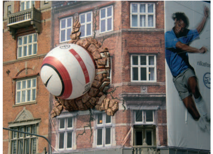
Reklameduge tillades generelt ikke. Reklameduge tillades kun på stilladser i forbindelse med renovering af facader og tage.