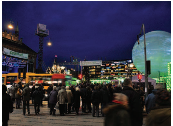
Reklameballon tillades kun undtagelsesvis i forbindelse med særlige events.