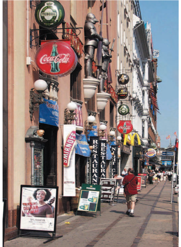
For mange skilte kan virke forvirrende på kunderne.

I forbindelse med tilladelser vurderes ansøgningen ud fra det konkrete sted, hvor byliv, trafik, antal af boliger, hensynet til bevaringsværdier og rekreative/grønne områder spiller en rolle.