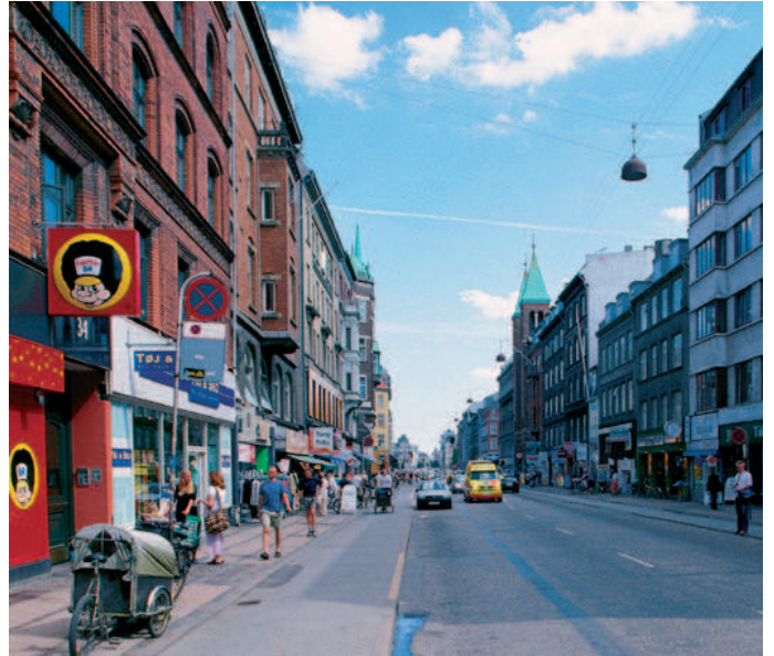
Brokvarterenes strøggader er præget af et livligt butiksliv.