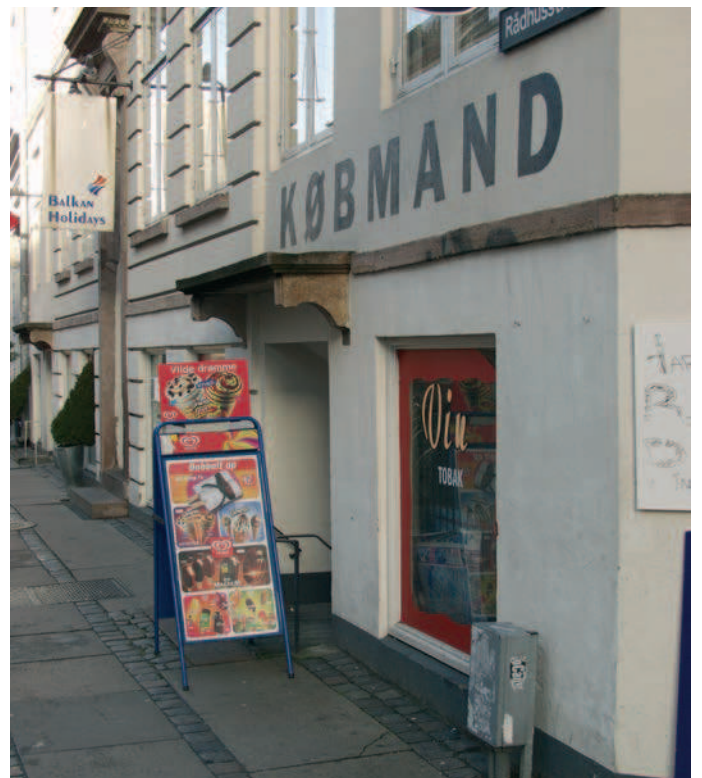
Skilteudstyr placeret på fortovsareal bør generelt begrænses af hensyn til fremkommeligheden.