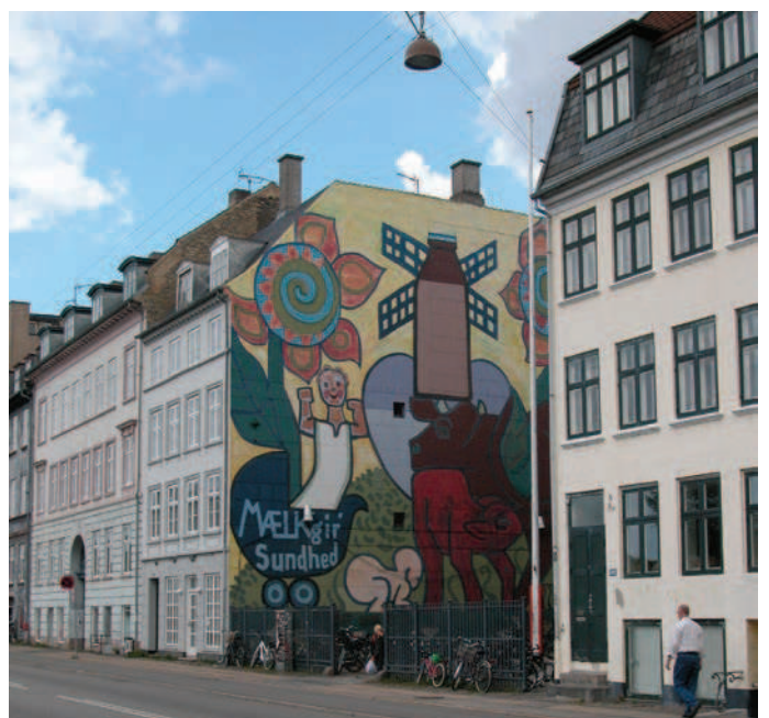
Heerups kendte mælkeklame, Sølvgade.