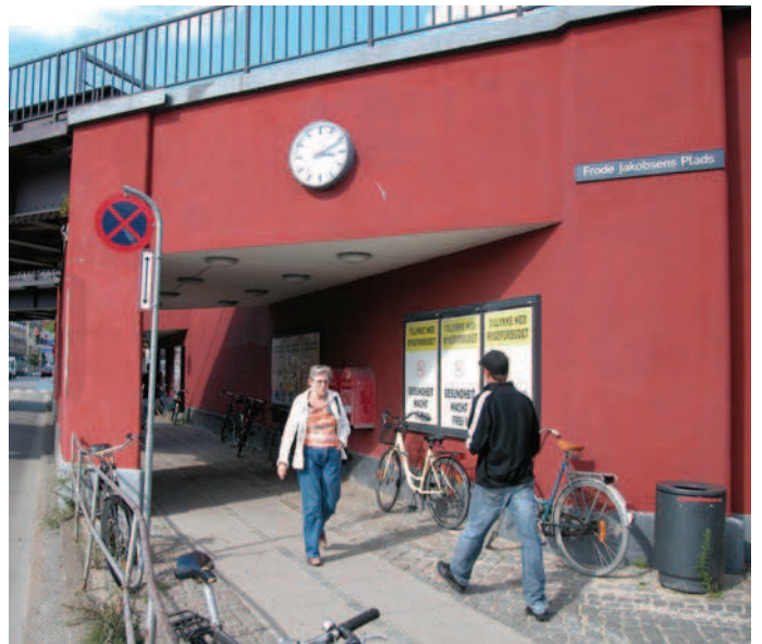
Belyste reklameskabe i gangrumarealer kan virke tryghedsskabende.