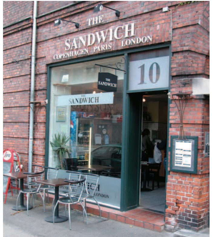
Her har man opnået en fin harmoni mellem skiltningen og bygningens facade med dens materialer og detaljer.