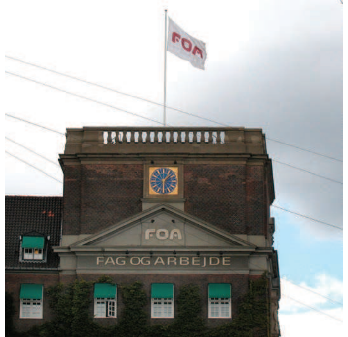
Det er tilladt at flage med firmalogo som her på hustage.