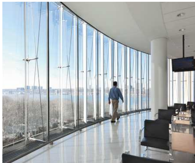
Referencefoto af lodret solafskærmning, som tænkes anvendt på hjørneprojektet. Foto fra Vivian and Seymour Milstein Family Heart Center, Presbyterian Hospital, 2010. Ill. og tegnet af Pei, Cobb Freed & Partners.

KØBENHAVNS KOMMUNE Teknik- og Miljøforvaltningen