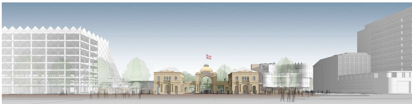
Projektet mod Vesterbrogade, hvor det alene er hjørnebebyggelsen, der er opført. Tivoli har oplyst, at de ønsker at starte med hjørnebebyggelsen, mens bebyggelsen mellem Industriens Hus og hovedindgangen først vil blive bygget i en senere fase. Ill. Pei Cobb Freed & Partners.