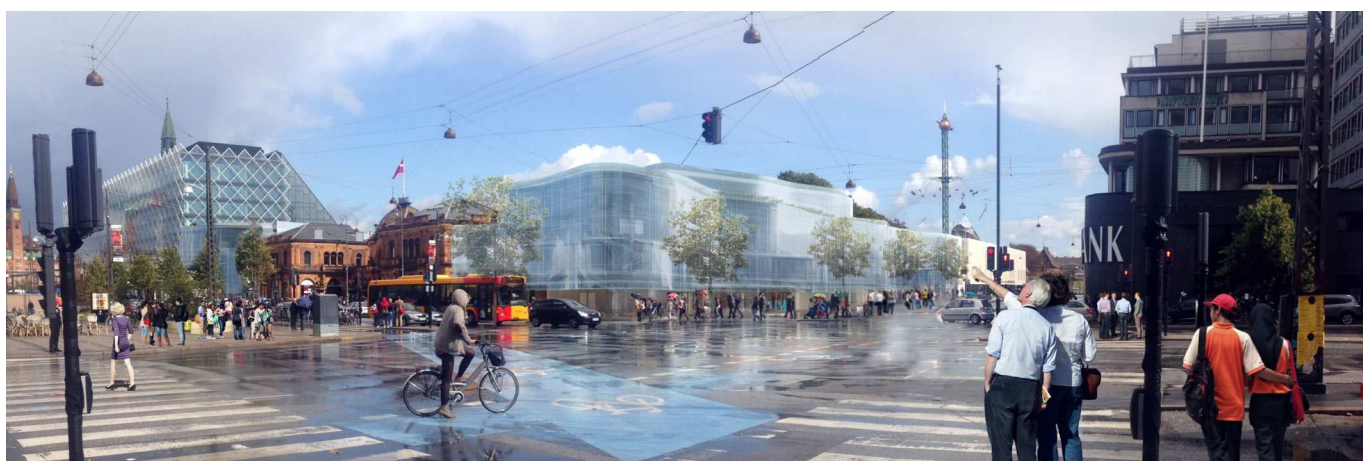
Projektet set fra hjørnet af Vesterbrogade og Hammerichsgade. Ill. Pei Cobb Freed & Partners.