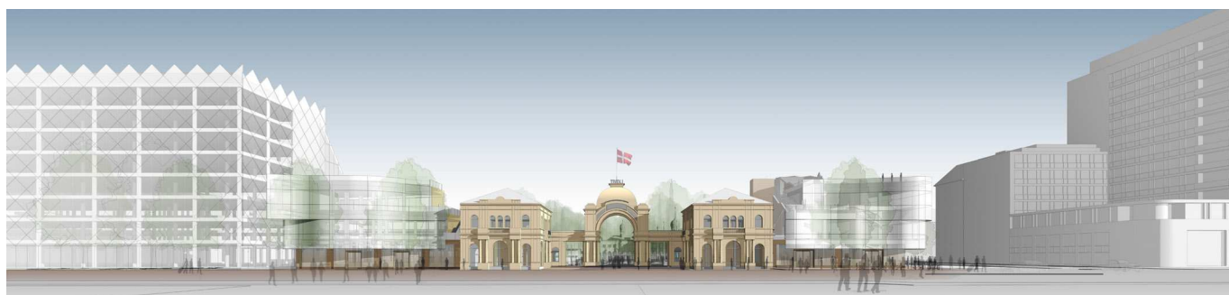
Projektet mod Vesterbrogade, hvor hele projektet er opført. Ill. Pei Cobb Freed & Partners.