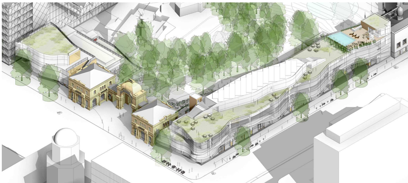
Projektet set fra luften mod Vesterbrogade og Bernstorffsgade. Taghaven begrønnes og der placeres solceller på tagetagen. Ill. Pei Cobb Freed & Partners .

det omkring Rådhuspladsen og Vesterbrogade er præget af serviceerhverv, butikker, biografer og restaurationer, og der er liv en stor del af døgnet.