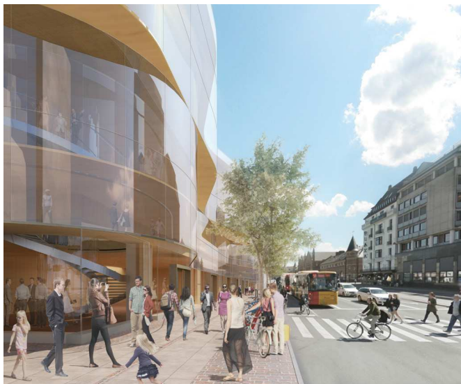
Projektet langs Bernstorffsgade, hvor fodgængerarealet er udvidet ved tilbagetrækningen af stueetagen, og den bølgede glasfacade krager ud over stueetagen og fortovet. Der placeres nye træer og cykelstativer. Ill. Pei Cobb Freed & Partners.

Mod Tivolihaven forholder facaden sig til det tilknyttede haverum, og refererer med sine terrasser til Tivolis øvrige scener.