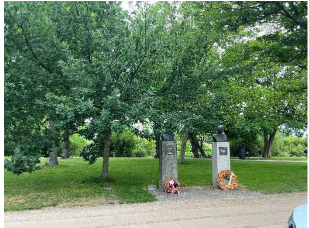
Fotos af nuværende gruspladser langs Amaliegade med busten af tre krigshelte: Anders Lassen, Kai Birksted og Thomas Dinesen