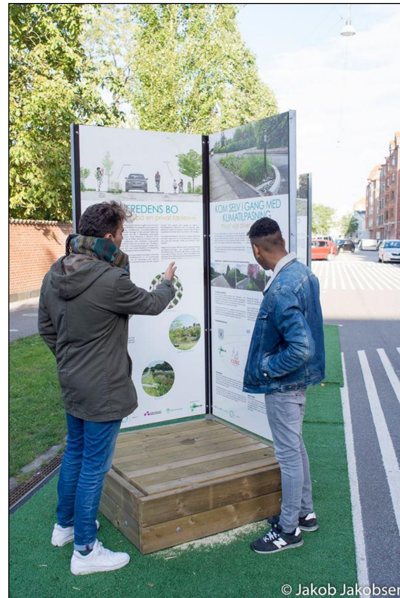
Foto: Udstilling om klimatilpasningsprojekter på Amager i forbindelse med Park in a Week.