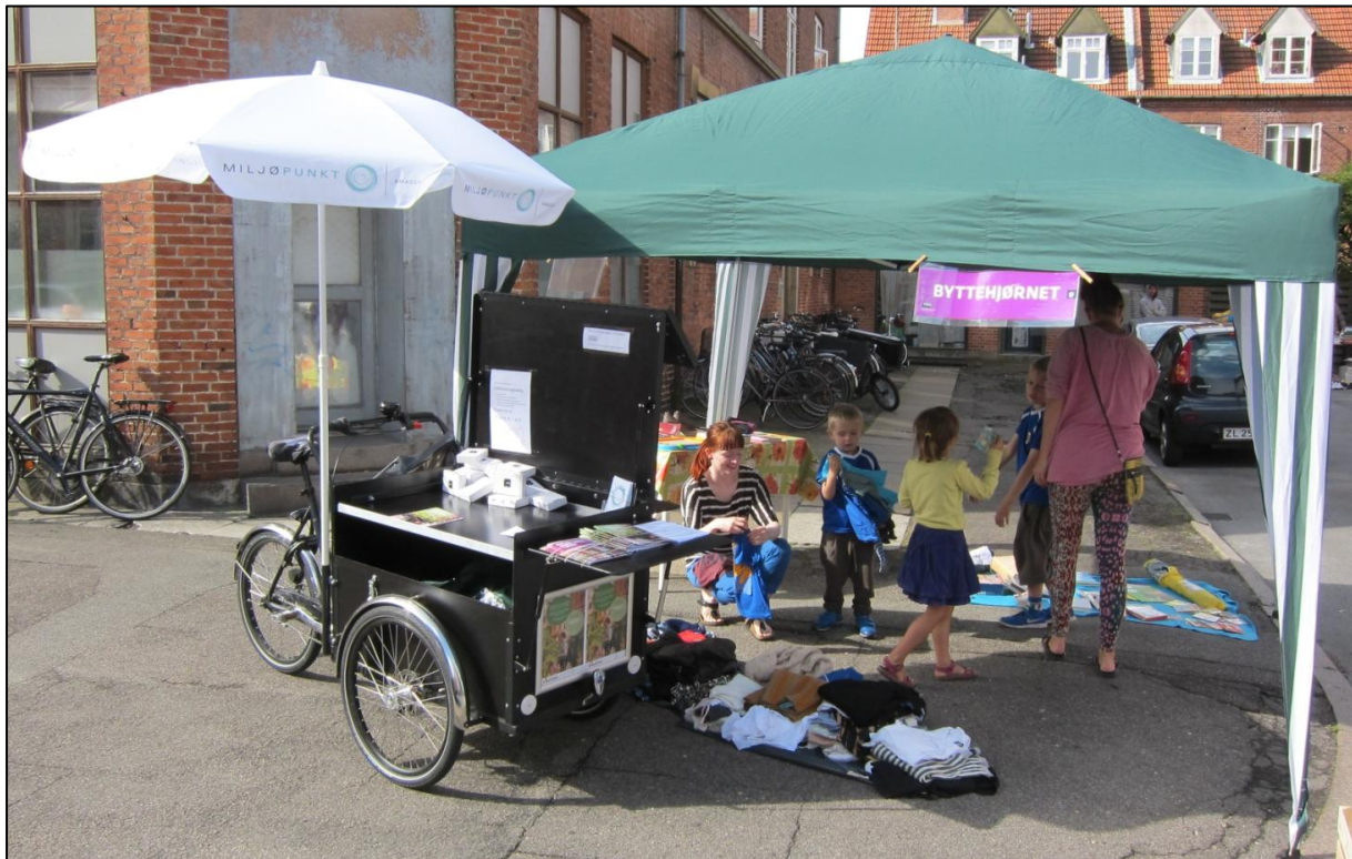
Foto: Byttehjørne til loppemarked på Ungarnsgade.