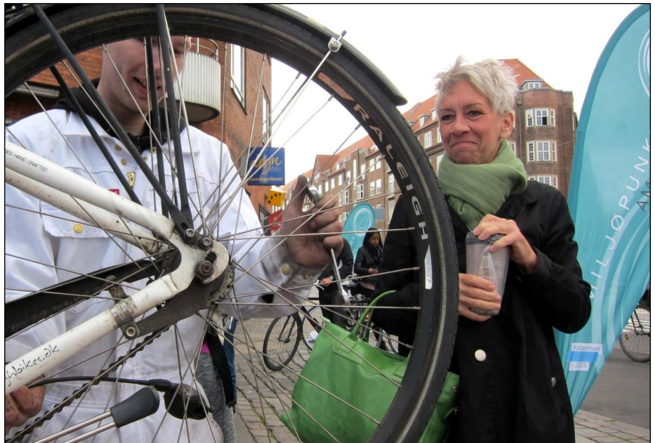
Foto: Cykelpitstop på Amagerbrogade.