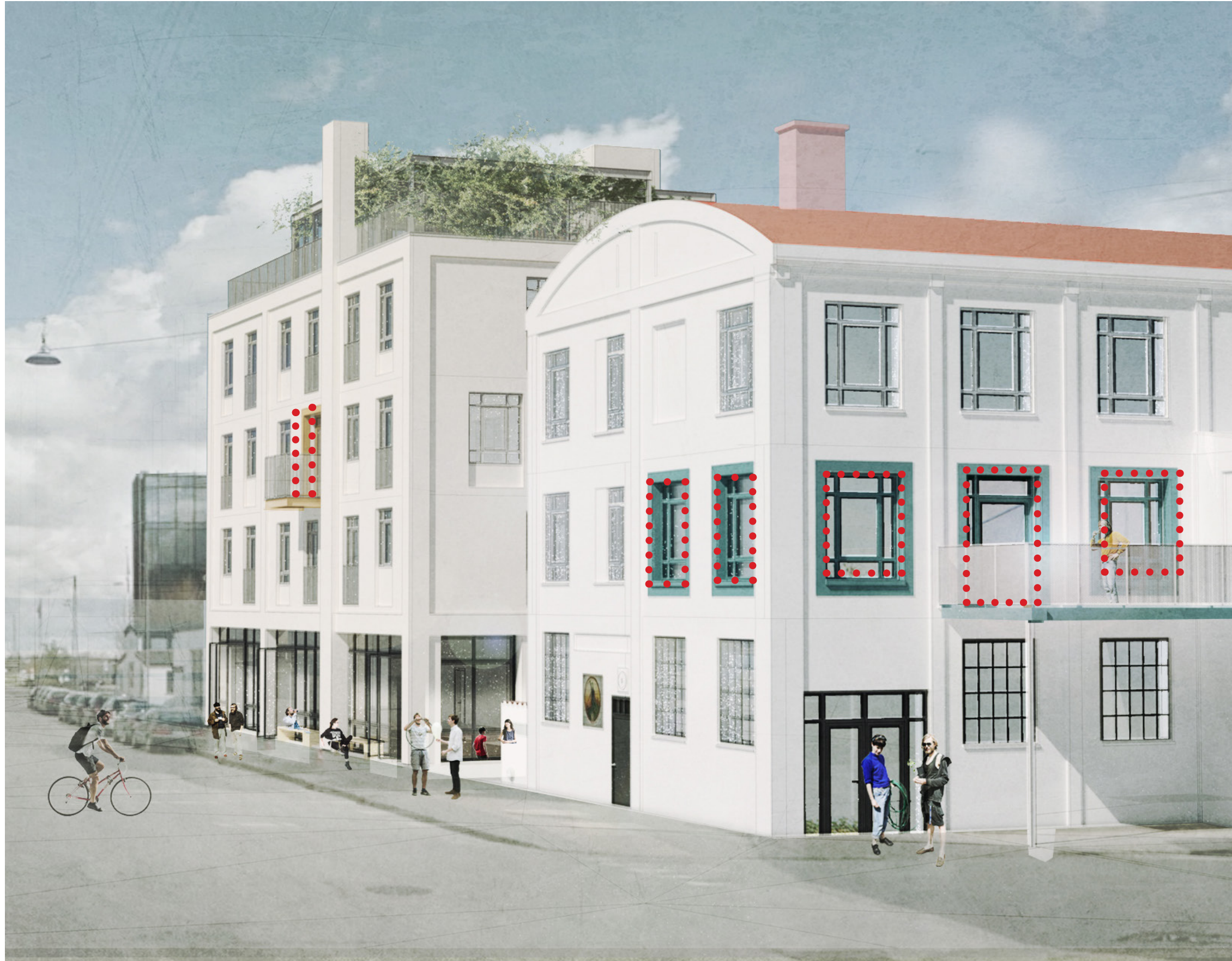
View fra hjørnet Strandlodsvej/Lindgreens Allé. Fællesrum markeres i facade med farvede lysninger /vinduesrammer i forskellige toner (markerede felter), og facade i stueetager detaljeres med koksgrå rammer og partier. Således markeres stueetagerne som et selvstændigt horisontalt 'bånd' og spiller videre på de industrielle motiver.