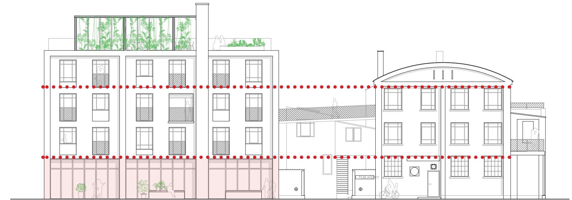
Markering af horisontale sigtelinjer