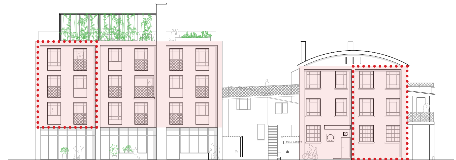
Proportionering og inddeling af facader