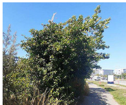
Selvgroet grøn kant mellem vej og byggefelt.