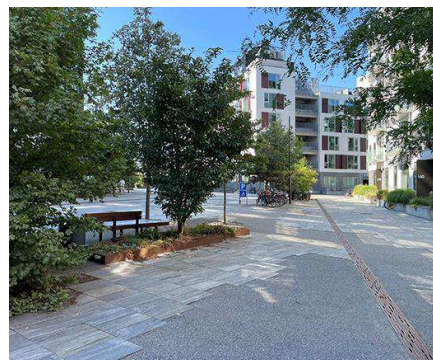
Byrumsforløbet med grøn beplantning mellem Metrostation og krydset ved Peder Lykkes Vej.