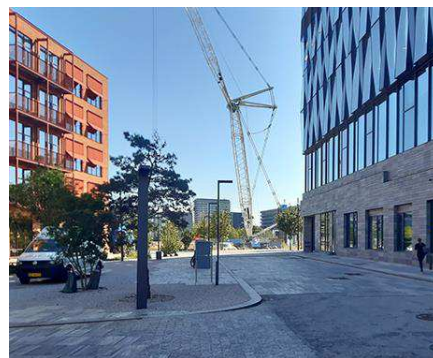
Byrumsforløbet set mod krydset, hvor materialer og farver på nybyggeri er repræsenteret.