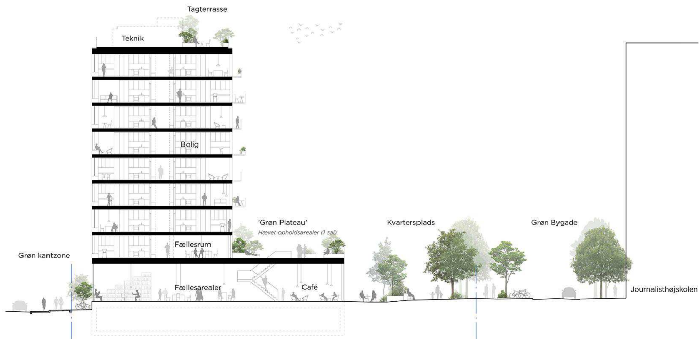
Snit, der viser et eksempel på nybyggeri. Illustration: EFFEKT.