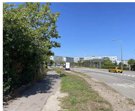
Amagerfælledvej. Nuværende situation med for-tov, grønt rabatareal, cykelsti og vejbane.

Bygherre har på den baggrund anmodet forvaltningerne om et nyt plangrundlag, som ændrer anvendelsen af ejendommen fra erhverv til bolig.