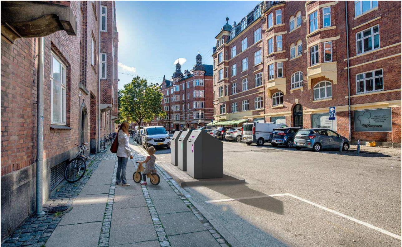
Eksempel på sorteringspunkt med tre kuber. Placering samt udformning af affaldsløsninger og anlæg er ikke nøjagtig gengivelse af, hvordan et sorteringspunkt kommer til at fremstå.