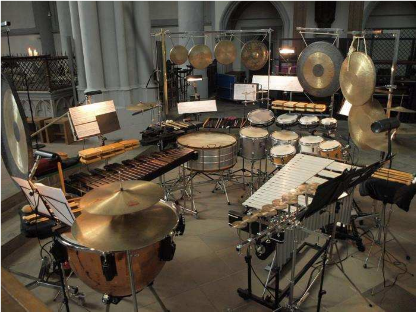
Tallerken med mærke i midten