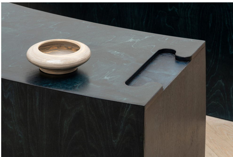
Portfolioeksempel, detalje: POOL 2020, Afgang 2020, Kunsthall Charlottenborg

Hvis installationen er opsat i et åbnet rum, vil forbigående publikum og nysgerrige kunne droppe ind, hvilket vil skabe et flow af mennesker omkring stykket.