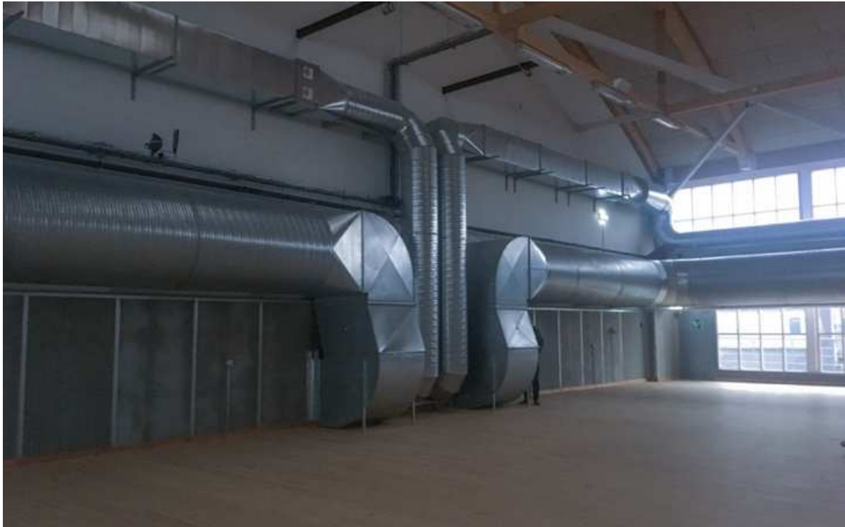
Billede taget fra Hal 6 på CC, hvor værket skal opføres. Hallen er ca. 4 gange så stor som det udsnit der vises på billedet.

I en scene forsvinder performerne ind under det tunge draperi, som pludselig transformeres til at være en bevægende krop i sig selv. I samspil med lydstrøgende dannes et teksturigt og langsomt transformerende rum for publikum at dvæle i.