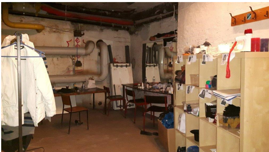
Billede 4. Garderobefunktion og backstage.