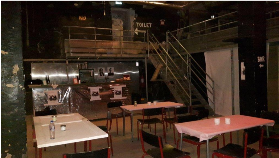
Billede 2. Aktivitetslokale.