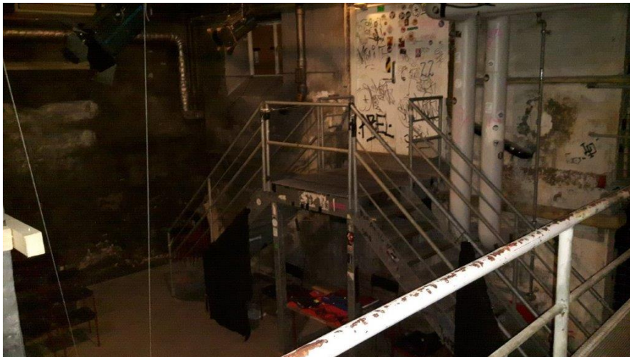
Billede 3. Aktivitetslokale.