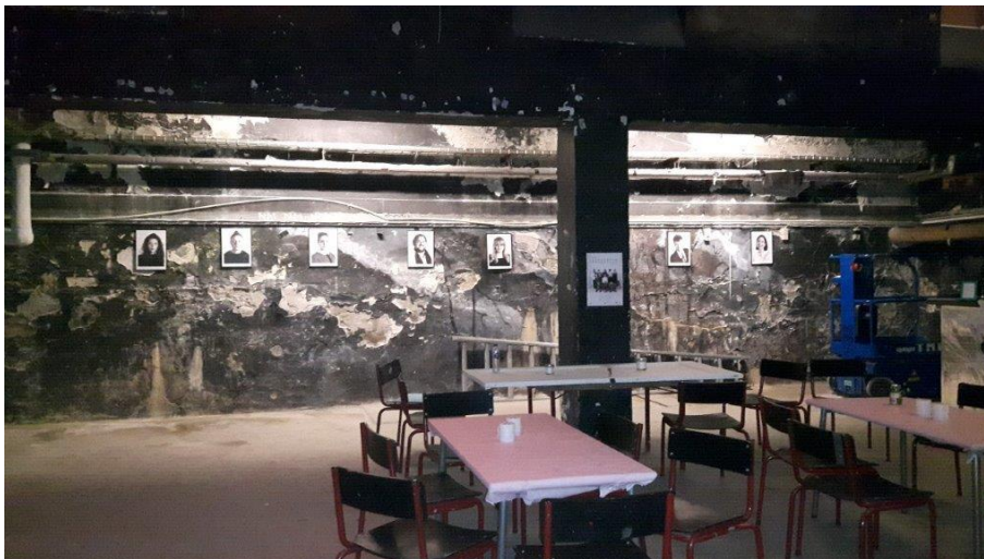
Billede 1. Aktivitetslokale.