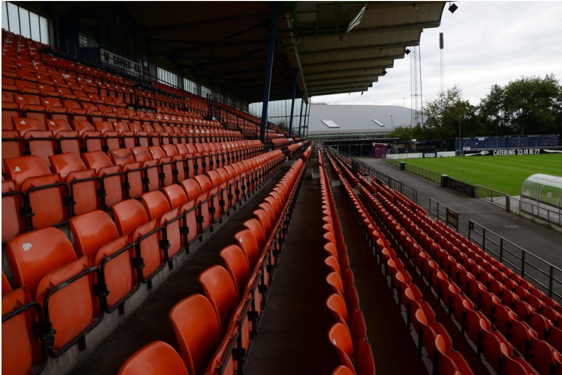
Foroven og forneden: Valby Stadion