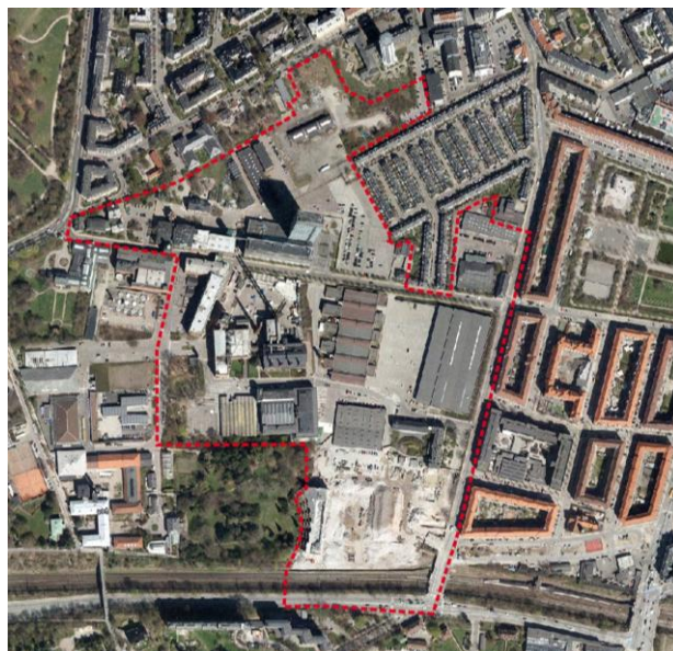
Lokalplantillægsområdet De to delarealer, hvor der fastlægges byggeretsgivende bestemmelser er ikke markeret på kortet.