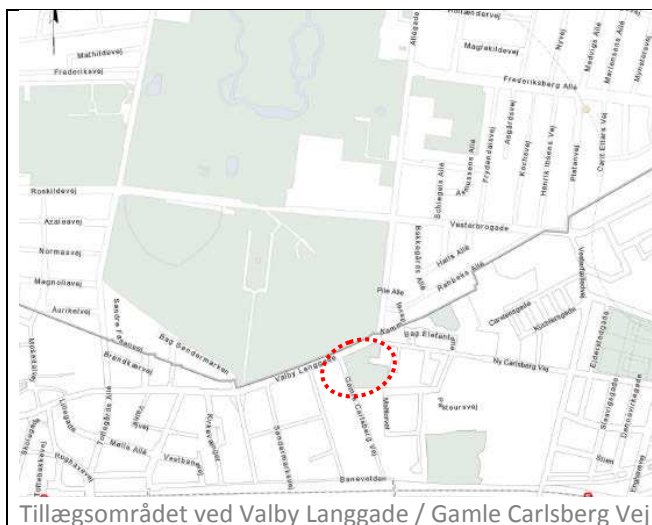
Tillægsområdet ved Valby Langgade / Gamle Carlsberg Vej