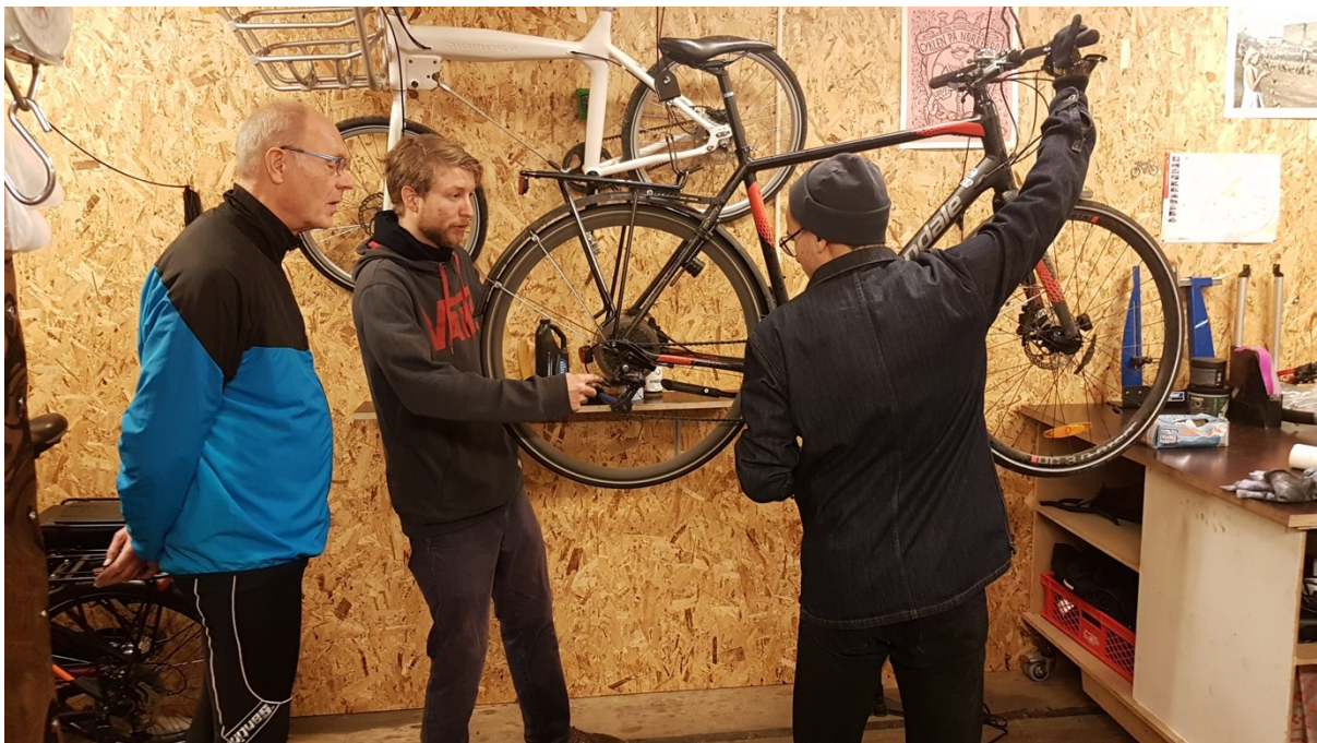
Cykelworkshop i Bicycle Innovation Lab

Det lykkedes til fulde Miljøpunkt Amager at realisere målsætningerne for indsatsen. Cykelbiblioteket er blevet opdateret og der har i 2018 været involveret 12 nye frivillige i at drive Cykelbiblioteket og Cykelværkstedet. Der er blevet skabt 42 nye samarbejder med cykelproducenter og lokale cykelhandlere. Heraf er ni af aftalerne med producenter som ikke tidligere solgte cykler i Danmark. Der er blevet etableret et mobilt cykelbibliotek og det er blevet afprøvet. Der er blevet afholdt en workshop i Cykelbiblioteket og to sammen med Gerbrandskolen. Og Miljøpunkt Amager har understøttet udviklingen af trafiklegepladsen og deltaget med aktiviteter på pladsen.