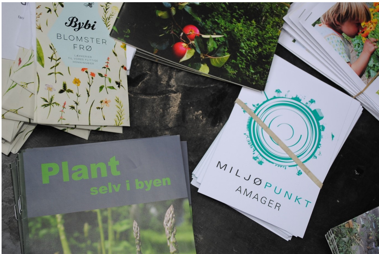
Inspirationsmaterialer til at gøre byen grønnere fra Plantekassedag i Kvarterhuset

I årsplanen for 2018 var det også et mål at tegne Amagers grønne profil endnu stærkere, bl.a. gennem at holde en nordisk konference med fokus på grøn byudvikling. Det lykkedes ikke at gennemføre konferencen i 2018. Ideen, erfaringerne og samarbejdspartnere tager vi med os i vores fremtidige planlægning. Til gengæld lykkedes det at arrangere en række erstatningsevents under titlen 'Vintergrøn' samt at afholde over 10 andre arrangementer der understreger det særlige grønne engagement på Amager.