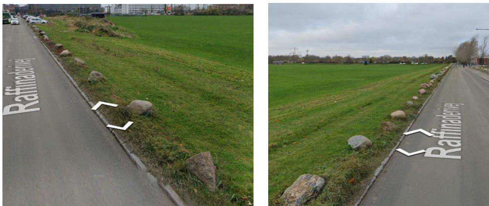
Fig.2. Billeder viser nuværende rabatkant af Raffinaderivej ind mod Kløvermarken (KK-kort)

Fredningstilsynet vurderer derfor, at det ansøgte, ikke vil medføre beskadigelse/ødelæggelse af plantearter eller yngle- og rasteområder for de dyrearter, der fremgår af habitatdirektivets bilag IV.