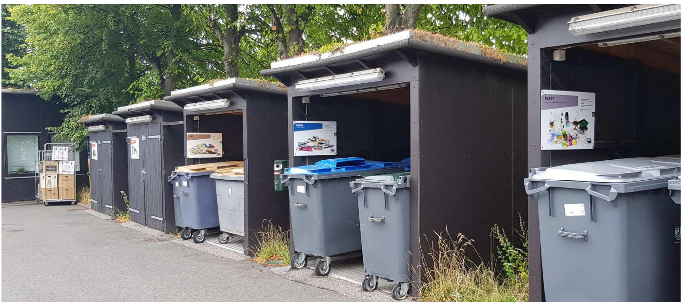
Kildesortering på Haraldsgade Nærgenbrugsstation

Fjernelsen af de store stålcontainere forventes at skubbe københavnere i retning af at kildesortere mere, hvorved genanvendelsen øges.