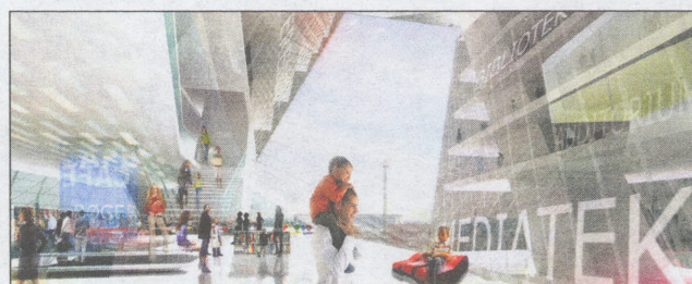
Projektet der forblev en drøm. Henning Larsens tegnestue forestillede sig i 2007 et 80 meter højt svar på Pompidou-centeret i Paris, en bygning med to plateauer med udsigt over København. (Ill: HLA)

- Generelt kan man sige, at der er interesse i at fortætte et stationsområde, det er med til at skabe en bæredygtig og mere intens bydel, men højhusarkitektur er en særlig disciplin, der kræver megen stillingtagen til, hvad