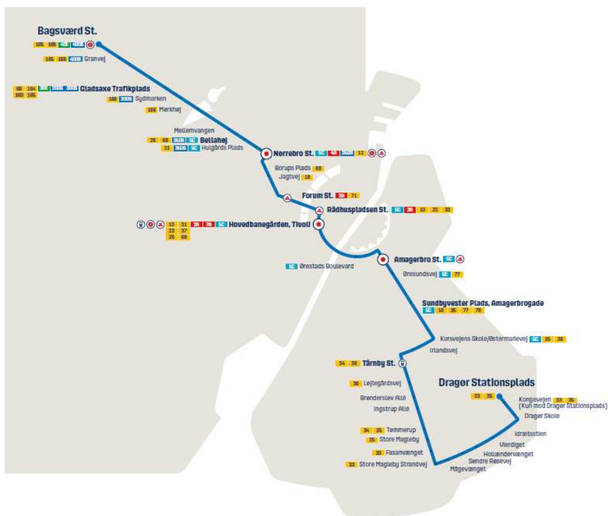
Figur 1 – Linjeføring for linje 250S.