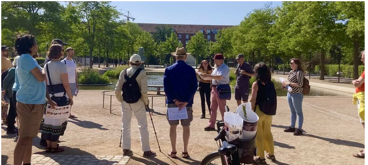
Stemmingsbillede fra Byvandring & barok SBD 2023

2. Byvandring Byvandring med pop-up koncerter Sted Østerbro Dato Lørdag d. 15. juni kl. 16-18 Entré 250 kr. incl. vinsmagsprøver Medvirkende Musica Cœlestis, Averi Baroque Beskrivelse En guidet byvandring, hvor vi oplever Ydre Østerbro med nye øjne og hører historier om de smukke bygninger. Turen kommer bl.a. igennem Komponistkvarteret, Frederik Bøttgers legendariske arbejderkvarter, bygget i stil som Kartoffelrækkerne og Humleby. Undervejs vil vi opleve musik af kvindelige komponister, leveret af Averi Baroque. Turen slutter på vinbaren Gotland, hvor der vil være vinsmagning, ledsaget af musik fra Musica Cœlestis.