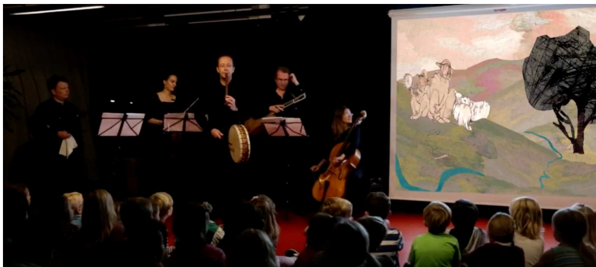
Foto fra forestillingen: "Den Morgen vi var Hyrder" 2016. Concerto Copenhagen

En visuel koncertfortælling for børn. Historien "Den morgen vi var hyrder" vækkes til live med lysbilleder, historieoplæsning og levende musik fra Danmarks kendteste barokorkester - med popcorn og saftvand! Koncerten arrangeres i samarbejde med Østerbro Koncertforening.