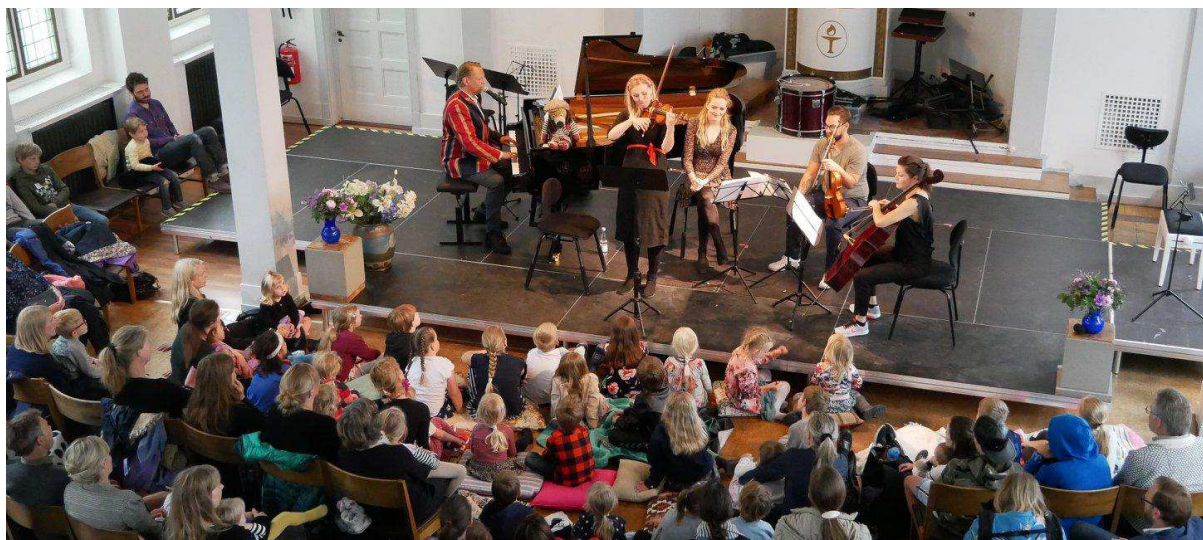
Stemningsbillede, børnekoncert i Unitarernes Hus med Østerbro Koncertforening