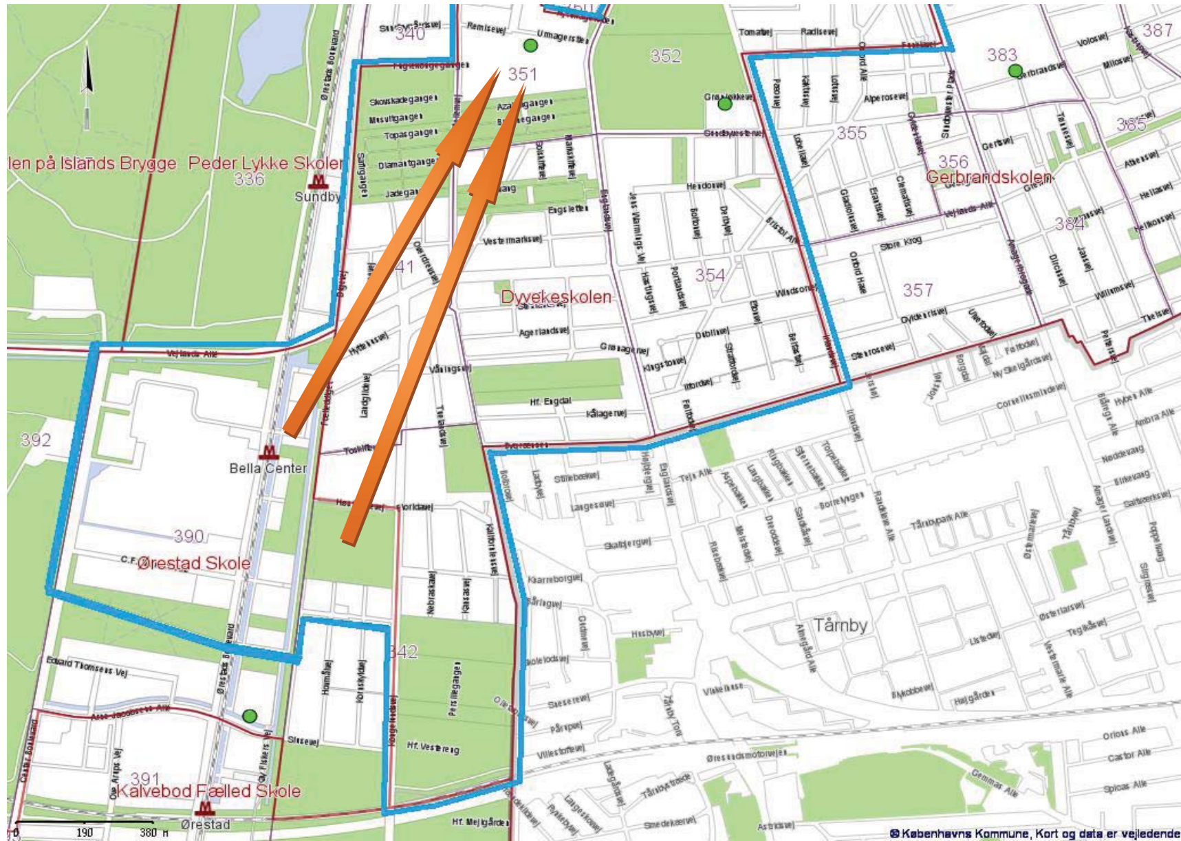
Kort b: Ændringer vedrørende Ørestads Skoles og Dyvekeskolens distrikter